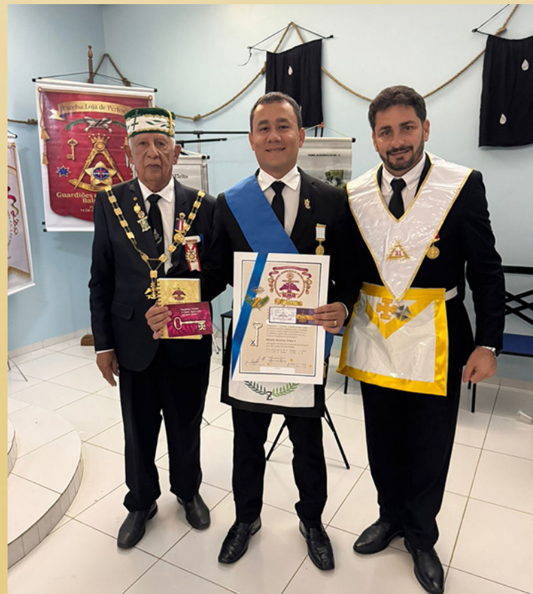
O GIL da 2ª MA e o Presidente da LP entregando as credenciais do Grau 4°.

Nosso especial agradecimento ao GIL da 2ª MA pelo envio de texto e fotos para a elaboração desta matéria.