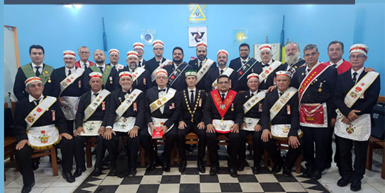
Membros da Comitiva Brasileira na reativação da LP Renacimiento nº 11.

Nosso especial agradecimento ao GIL do Acre pelo envio de texto e fotos para a elaboração desta matéria.