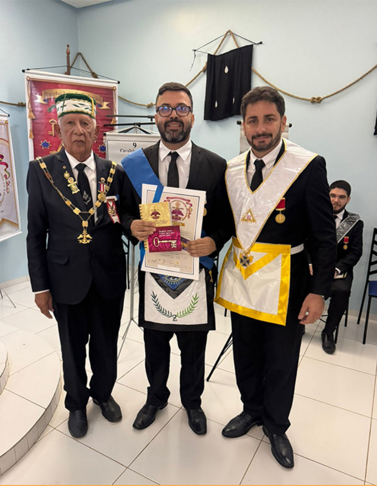
O GIL da 2ª MA e o Presidente da LP entregando as credenciais do Grau 4°.

não se constroem no imediatismo, mas no tempo justo, com constância, silêncio e fidelidade ao propósito.