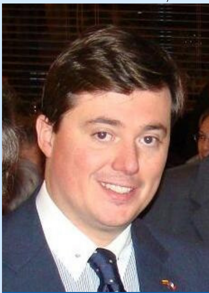
Nosso Irmão, senador Christophe-André Frassa.

Às 17h30, estava programado uma visita ao Palácio de Luxemburgo, onde foi oferecido um Coquetel às delegações, seguido de um Jantar Fraternal, no Restaurante do Senado francês.