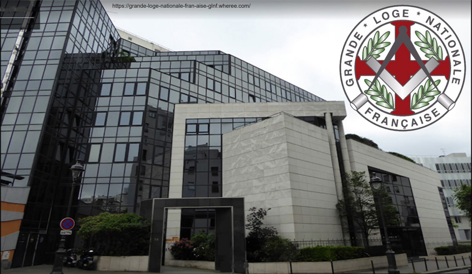
Vista frontal da bela sede da Grande Loja Nacional da França, em Paris, onde foram realizadas as atividades ritualísticas, no Maisons de Maçons.

localizado no 1º “arrondissement”. A Torre Eiffel, por exemplo, está localizada no 7º “arrondissement”.