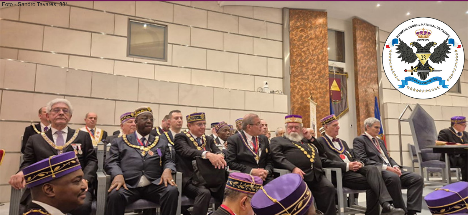
Os Soberanos Grandes Comendadores na sessão ritualística no Grau 31°, realizada no Maisons de Maçons, Templo Nobre da Grande Loja Nacional da França.

atualmente se renova com muita rapidez com novos e criativos nomes, é de imensa responsabilidade do país”.