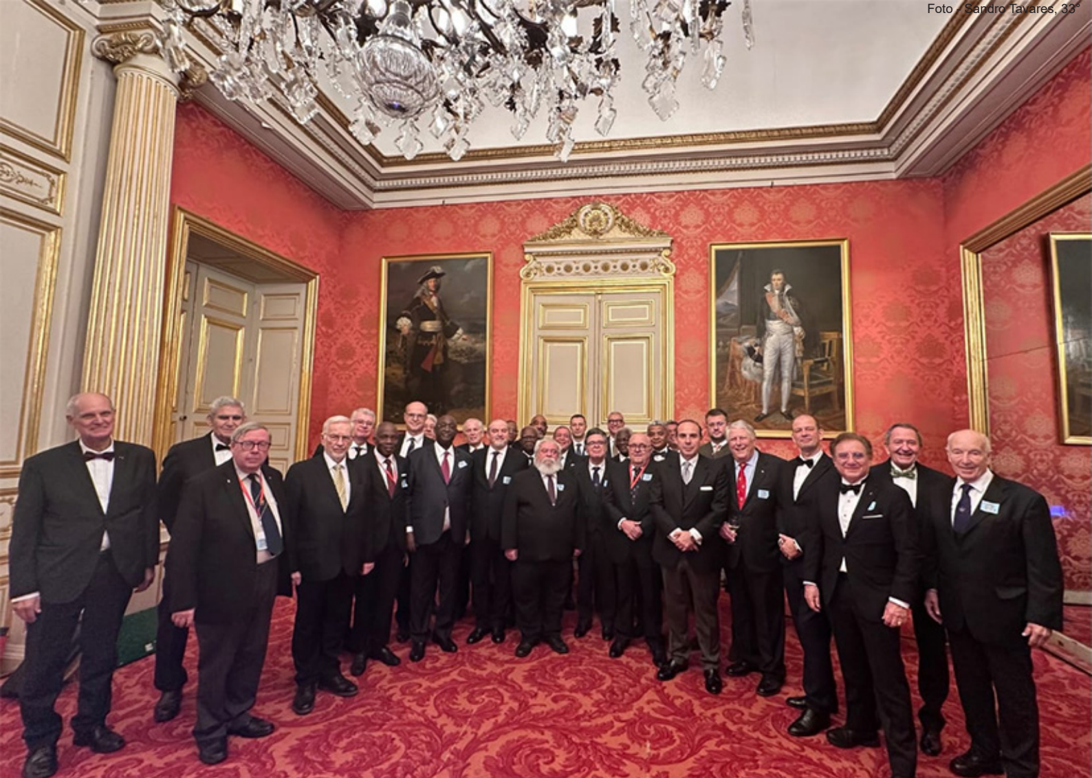
Os Soberanos Grandes Comendadores participantes em visita ao Palácio de Luxemburgo, sede do Senado francês, onde foi oferecido um Jantar de Confraternização.

Anualmente, o Supremo Conselho Nacional da França realiza sua tradicional Festa da Ordem, reunindo diversos Supremos Conselhos em uma festa em momento solsticial, que é uma herança que a Maçonaria herdou da Antiguidade, o que ratifica ser nossa Ordem o repositório de diversas Tradições do passado. Tais eventos realizados pelas Potências/Obediências Maçônicas Simbólicas, também, observam essas datas, não somente como uma tradição, mas atentando, também, para seus aspectos mágico, esotérico, transcendental.