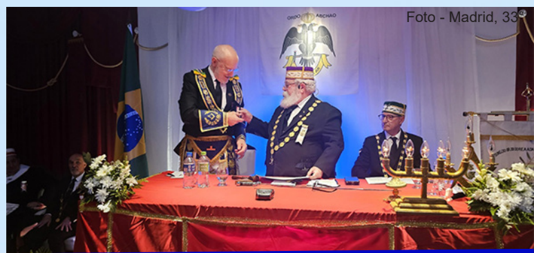
O SGC entregando a Comenda de 196 anos do SC ao GM Adj. da GLMERGS.