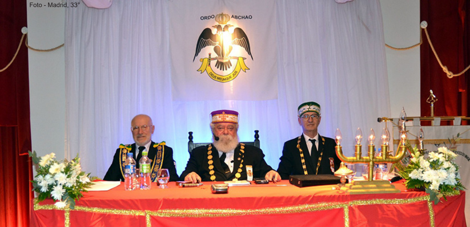
No Trono, ao centro, o Soberano Grande Comendador; a sua direita, o Grão-Mestre Adjunto da GLMERGS; a sua esquerda, o Grande Inspetor Litúrgico da 7ª RS.

desenvolvimento. A partir do sucesso obtido, a festa passou a contar com presenças ilustres e transformou-se em um dos maiores eventos temáticos do Brasil. A Festa da Uva passou a constituir o maior evento profano da cidade, associando a glorificação do trabalho dos italianos com as possibilidades do festejo como um importante fórum econômico.