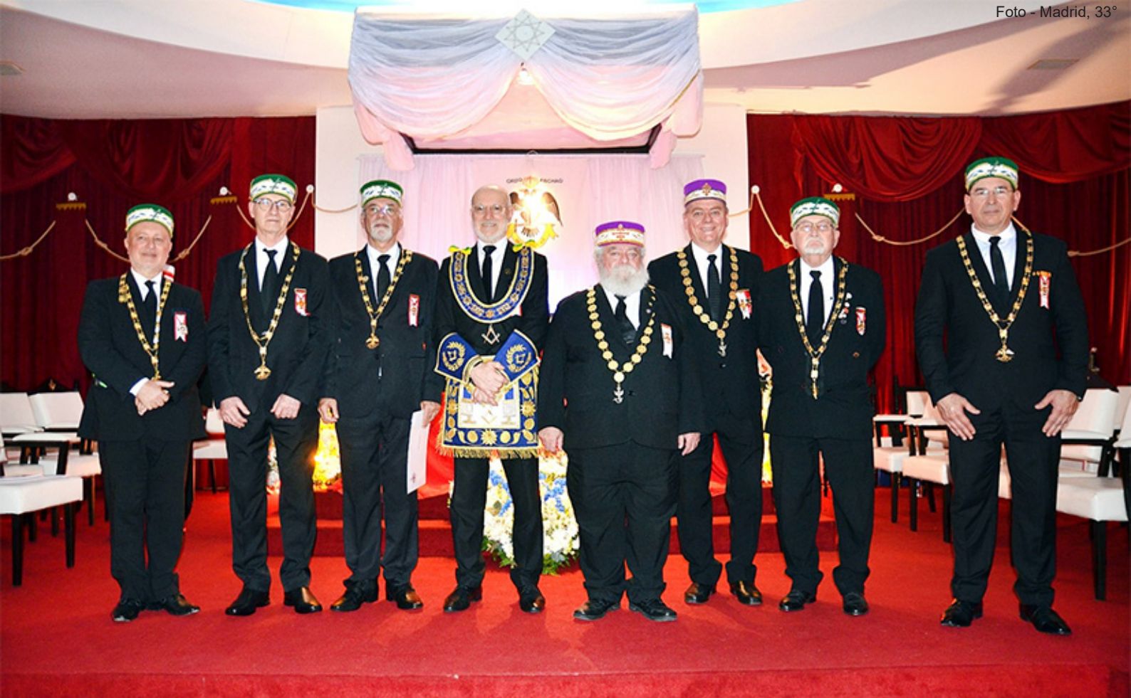
O Soberano Grande Comendador ladeado pelo GM Adj. da GLMERGS e pelos Grandes Inspectores Litúrgicos da 1ª, 2ª, 3ª, 4ª, 7ª e 8ª Regiões do Rio Grande do Sul.

criteriosamente, os preceitos do Grau 33°, investiu-os no Grau Maior do REAA.