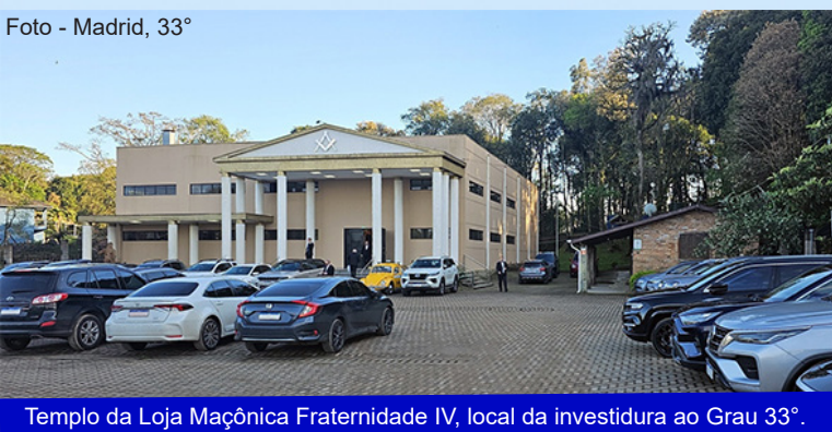
Templo da Loja Maçônica Fraternidade IV, local da investidura ao Grau 33°.

Em 1931, acontecia a primeira Festa da Uva em Caxias do Sul, em uma cidade em pleno