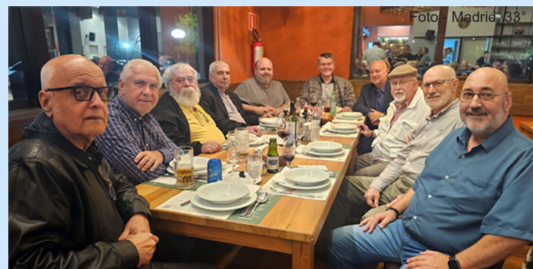
Jantar de Boas-Vindas, em recepção à Comitativa do Supremo Conselho.

Em pesquisas na Internet podemos nos enveredar em sua história e em sua cultura. Fundada em 1890, a cidade antes do nome atual já se chamou Campo dos Bugres (até 1877); Colônia de Caxias (até