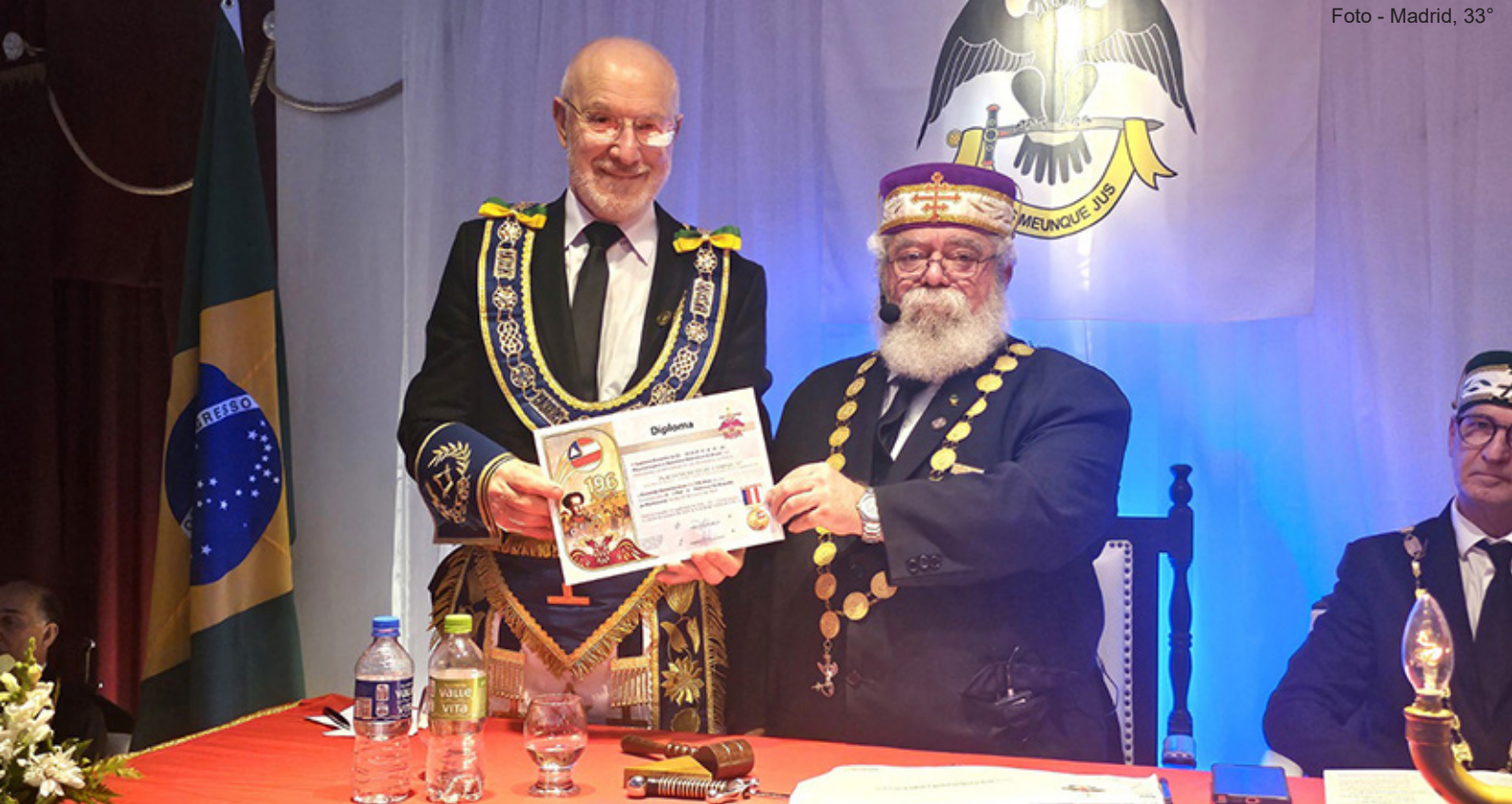
O Soberano Grande Comendador agraciou o Grão-Mestre Adjunto da GLMERGS com a Comenda e o Diploma de 196 anos de fundação do Supremo Conselho.

janeiro de 1887, na época, a região era denominada de Santa Thereza de Caxias. Quando de sua fundação a Loja estava vinculada ao Grande Oriente do Brasil. Atualmente, a Loja pertence ao Grande Oriente do Rio Grande do Sul, confederado à COMAB – Confederação Maçônica do Brasil.