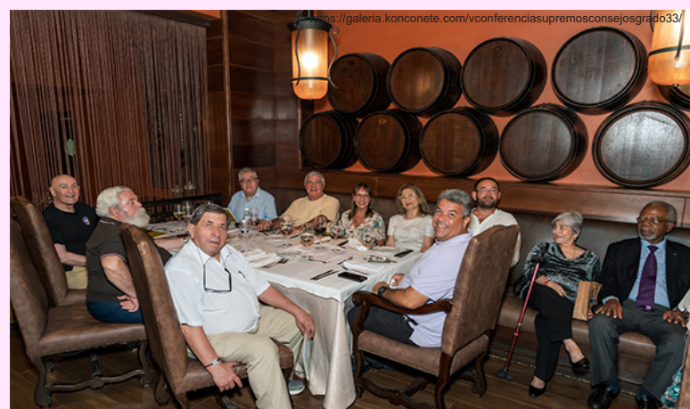
Comitiva Brasileira no Jantar de Boas-vindas da V Conferência.

Entre os primeiros maçons estavam não apenas Juan Pablo Duarte, “Pai da Nação” , mas