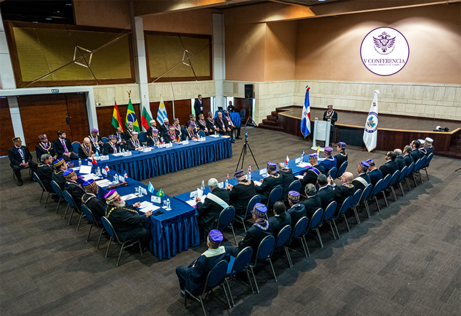
A Assembleia Geral da 5ª Conferência dos Supremos Conselhos da América Central e do Caribe com a participação de 17 Supremos Conselhos.

também quase todos os membros de “ La Trinitaria ”, bem como Gregorio Luperón, entre outras figuras da história dominicana.