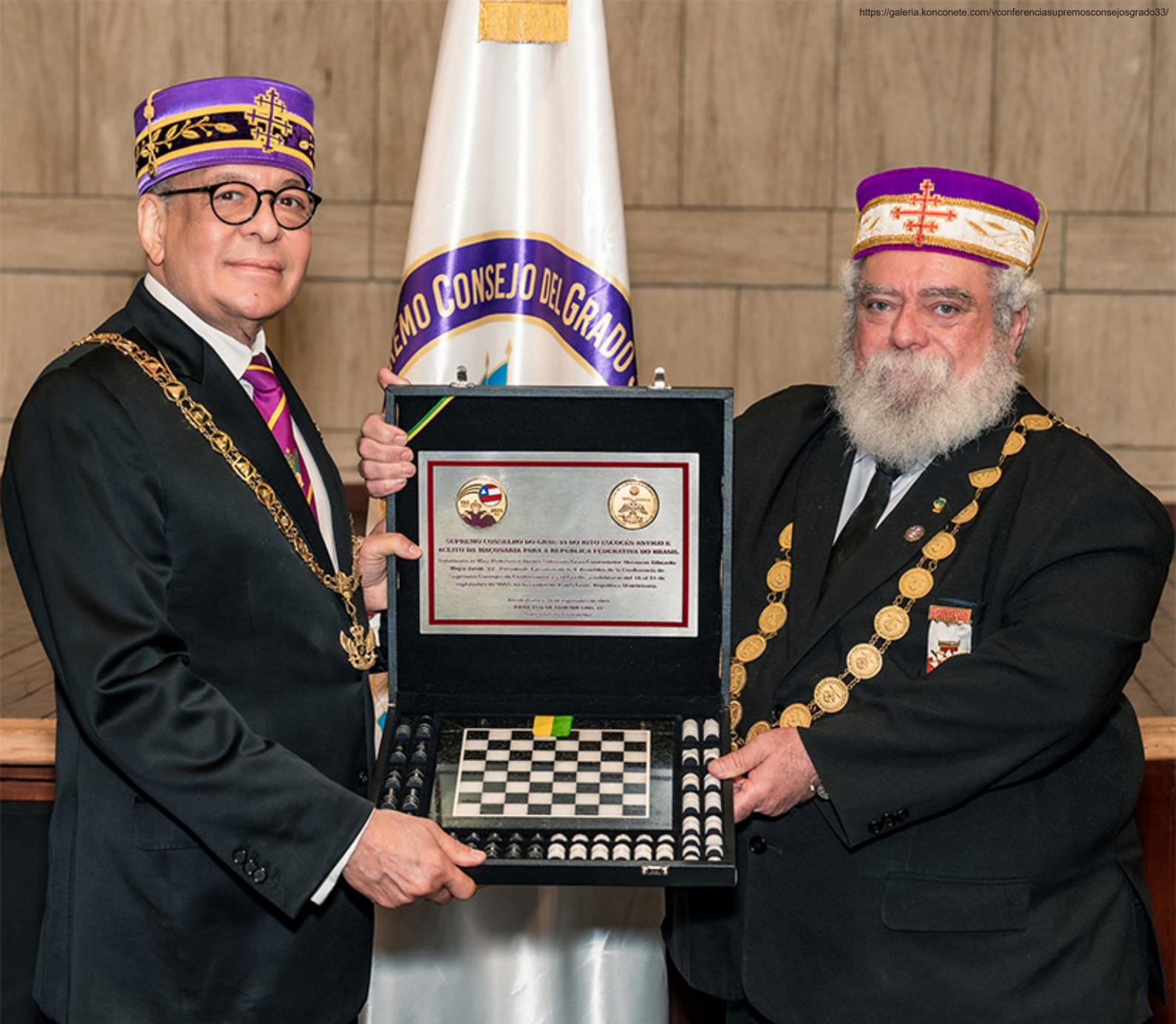
O SGC Jorge Lins, 33° registrou a presença do nosso Supremo Conselho entregando uma Placa Comemorativa e um mimo ao SGC anfitrião.

Comendadores e dois por seus Lugares Tenentes Comendadores (Cuba e Costa Rica). Relacionamos por Ordem de fundação, os Supremos Conselhos dos seguintes países: Brasil, Peru, Uruguai, Argentina, Cuba, México, República Dominicana, Costa Rica, Paraguai, Guatemala, Panamá, República Tcheca, Bolívia, El Salvador, Honduras, Colômbia e Bulgária.