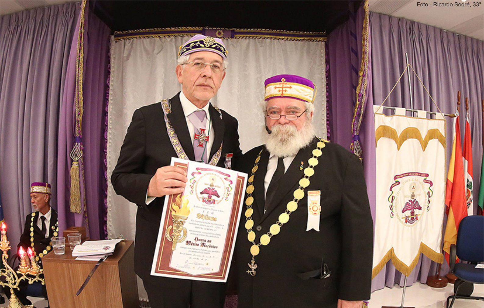
O Soberano Grande Comendador outorgou o título de Honra ao Mérito Maçônico ao Soberano Grande Comendador do Supremo Conselho para Portugal.

Em seguida, o Soberano Grande Comendador solicitou ao Grande Secretário Geral do Santo Império que procedesse a leitura do Decreto nº 009 - 2023/2028, do Supremo Conselho, ratificando o reconhecimento da antiguidade do Supremo Conselho para Portugal, no ano de 1841, através de Carta de Autorização concedida, na época, pelo nosso Supremo Conselho. Na oportunidade, o Soberano Grande Comendador fez a entrega da cópia da Carta de Autorização ao Supremo Conselho para Portugal, a seu Soberano