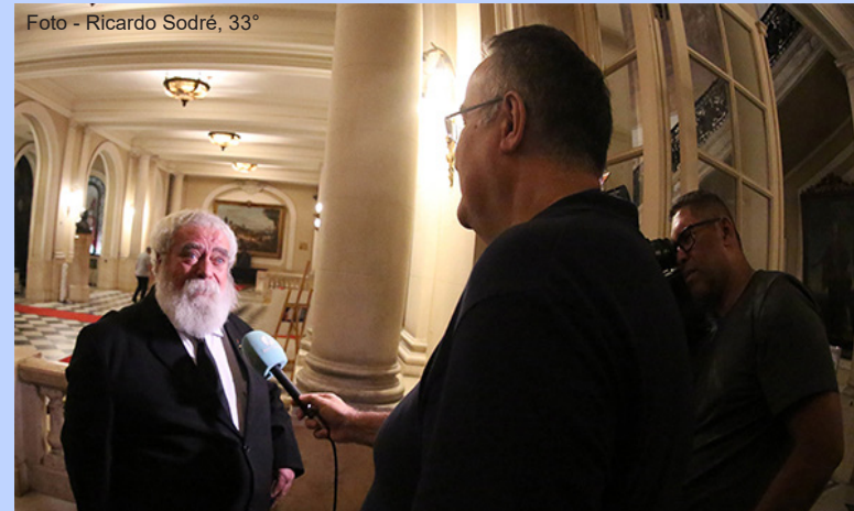
O Soberano Grande Comendador concede uma entrevista à Rio TV Câmara.