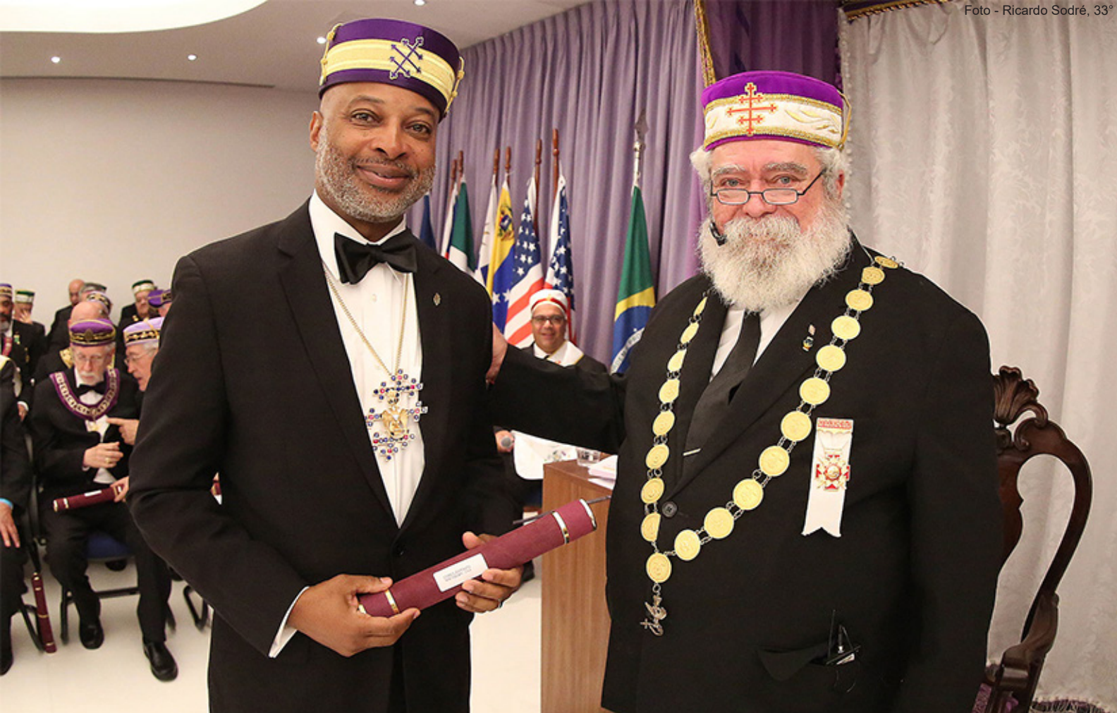
O Soberano Grande Comendador outorgou o título de Membro Emérito de Honra ao Soberano Grande Comendador do SC EUA - Prince Hall - Sul.

Todos os Soberanos Grandes Comendadores, Representantes de Supremos Conselhos e membros das Comitivas participantes, assim como os Grão-Mestres e autoridades do Simbolismo foram agraciados com a outorga da Comenda e do Diploma alusivos aos 195 de fundação do Supremo Conselho. Os Supremos Conselhos e as instituições do Simbolismo participantes, através de seus dirigentes/representantes, foram agraciados com a Medalha e o Diploma da mesma honraria.