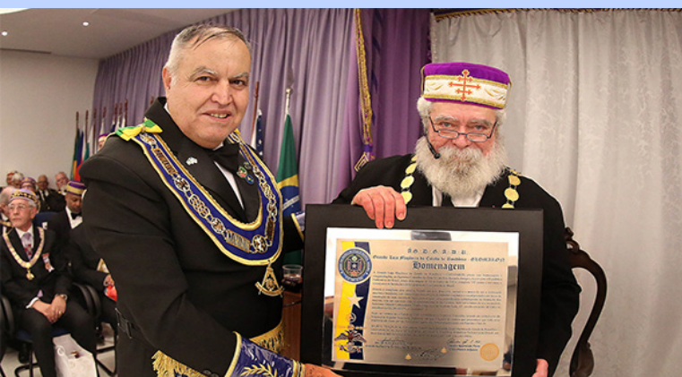
O Presidente da 52ª AGO da CMSB e Sereníssimo Grão-Mestre da GLOMARON presta sua homenagem ao Supremo Conselho, com uma Placa alusiva ao evento.

Rumo à eternidade, essa nobilíssima instituição segue perseverante em seu altruístico trabalho de aperfeiçoamento moral e espiritual do Maçom. ✍