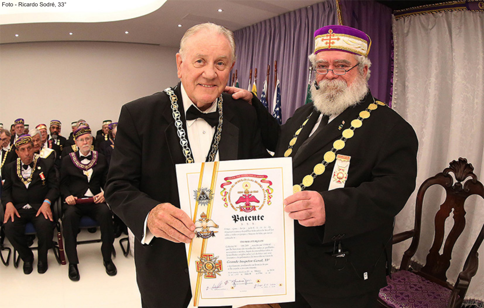
O Soberano Grande Comendador outorgou o título de Grande Inspetor Geral ao Representante do Supremo Conselho dos EUA - Jurisdição Norte.

o Grande Chanceler de Relações Exteriores dos USA - Jurisdição Norte; e o Grande Arquivista e Grande Historiador dos USA – Jurisdição Sul.