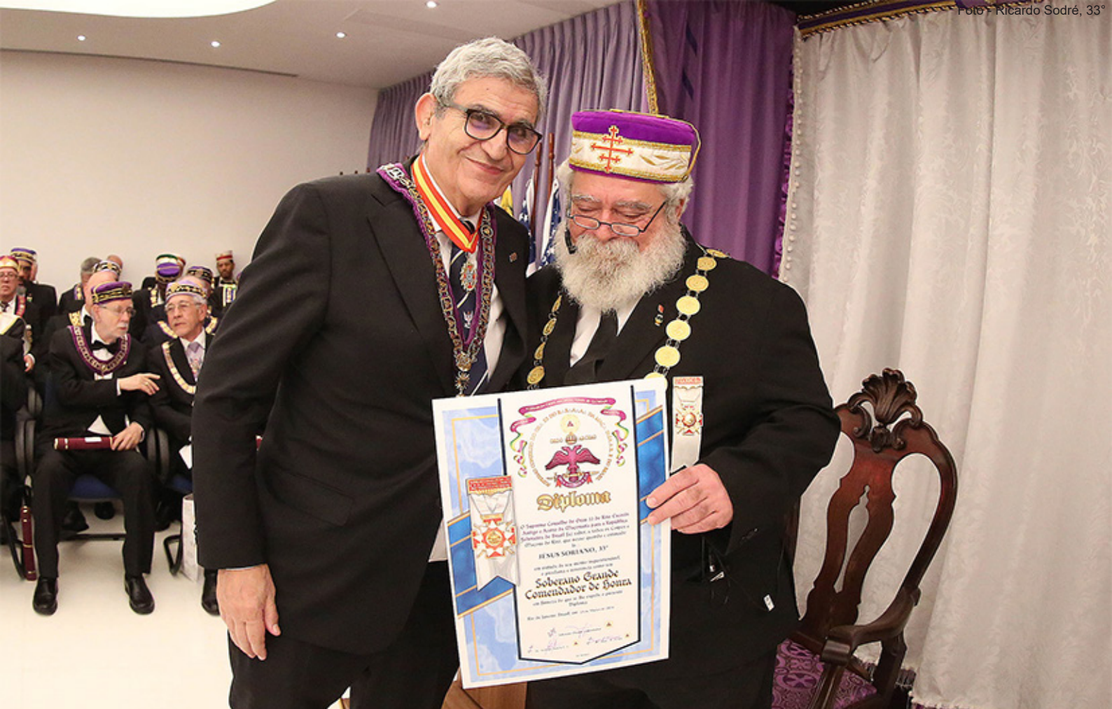
O Soberano Grande Comendador outorgou o título de Soberano Grande Comendador de Honra ao Soberano Grande Comendador do SC para a Espanha.

presidida pelo Soberano Grande Comendador, que os investiu no Grau de Grande Inspetor Geral, conforme o que preceitua nosso Ritual.