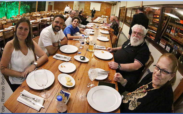
O Soberano Grande Comendador e seus familiares no Jantar de Confraternização.

As 16h, teve início a Sessão Solene comemorativa do 195º aniversário de fundação do Supremo Conselho, com a Cerimônia de Investidura ao Grau 33º, de 35 novos Grandes Inspetores Gerais, distribuídos por seus respectivos Consistórios, Vales e Inspetorias Litúrgicas: CPPRS Soberano Grande