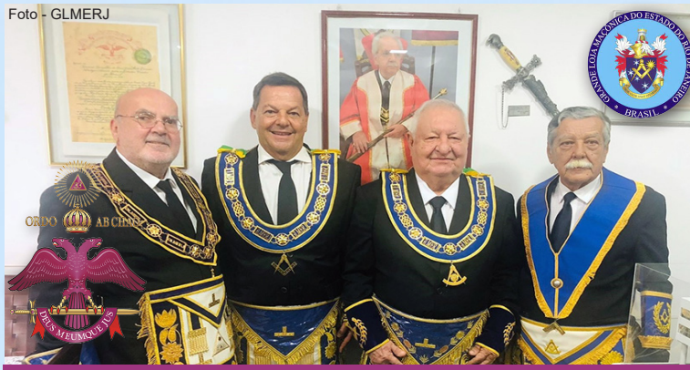
A partir da esquerda, o Grão-Mestre e o Grão-Mestre Adjunto empossados, o Grão-Mestre e o Grão-Mestre Adjunto que deixaram a direção da GLMERJ.