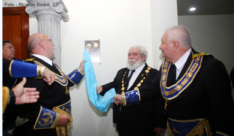
O SGC, o Grão-Mestre e o Grão-Mestre Adjunto da GLMERJ descerrando a Placa, na inauguração do Templo Simbólico na sede do Supremo Conselho.

Ratificando seu compromisso de incondicional apoio aos Graus Simbólicos do REAA, o Supremo Conselho, também, no mês de abril, inaugurou, em sua sede, um templo exclusivo para os Graus Simbólicos. Trata-se da complementação do projeto de concentrar, na sede do Supremo Conselho, Templos de todos os Graus do REAA, a fim de atender à prática ritualística.