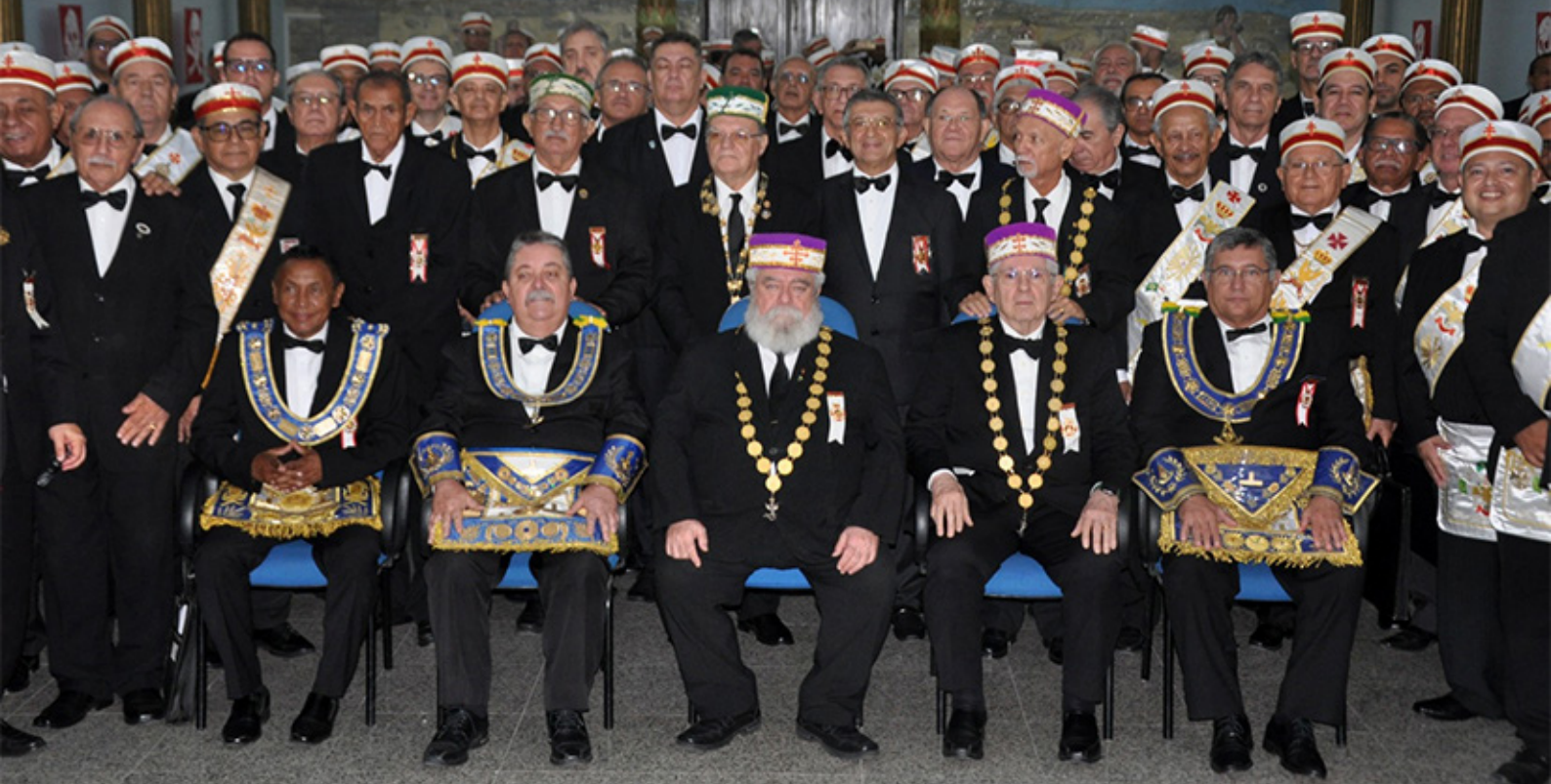
Cerimônia de Investidura de 73 novos Grandes Inspetores Gerais, realizada na cidade de Fortaleza - sede da 1ª Grande Inspeção Litúrgica do estado do Ceará.

De volta à região Nordeste, chegamos a Aracaju, em Sergipe. Mais uma investidura no mês de novembro, essa computando 48 novos Grandes Inspetores Gerais, sob a coordenação da Grande Inspeção Litúrgica do Sergipe. A “ Cidade da Qualidade de Vida ”, título que ostenta com orgulho, também, foi palco da comemoração do Jubileu de Esmeralda da GLMESE – Grande Loja Maçônica do Estado do Sergipe. Destaque para as singulares presenças dos Sereníssimos Grão-Mestres da GLMESE, da GLEPA; da GLOMEAL; do Grande Mestre da Ordem DeMolay Internacional; do Grande Rei do Grande Capítulo de Maçons do Real do Brasil.