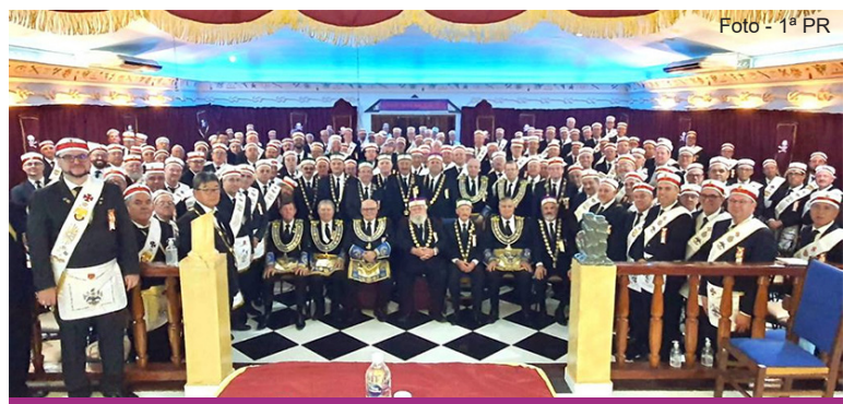
Cerimônia de Investidura de 95 Irmãos em Campo Mourão - 2ª GIL do Paraná.

A capital goianiense foi o próximo destino. Em Goiânia está localizada a sede da 1ª Grande Inspetoria