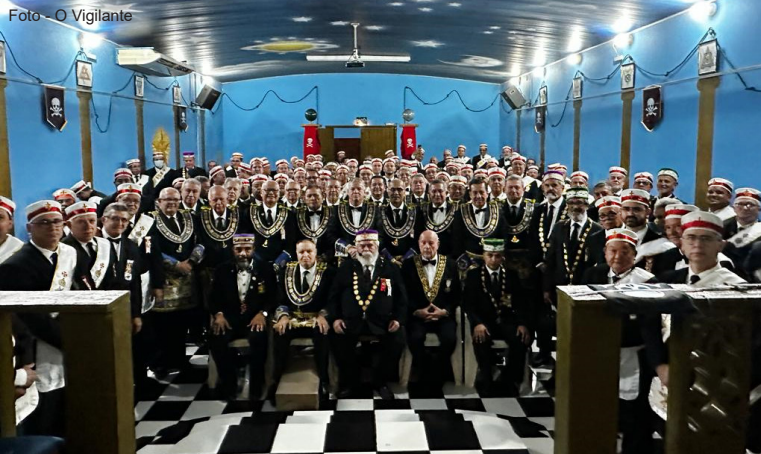
Cerimônia de Investidura em Porto Velho, dentro da programação da CMSB 2023.

cidade do Rio de Janeiro. Na “Paris dos Trópicos”, como é chamada a capital amazonense, foram investidos 29 Irmãos.