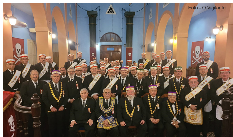
Cerimônia de Investidura de 29 Irmãos, em Manaus - sede da GIL do Amazonas.

A quarta investidura do ano de 2023 teve lugar na cidade de Manaus, sede da Grande Inspeção Litúrgica do Amazonas, quase 3.000 km distante da