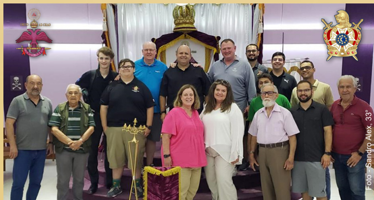
A Comitiva da Ordem DeMolay Internacional liderada pelo seu Grande Mestre Internacional, sendo recepcionada na sede do Supremo Conselho.