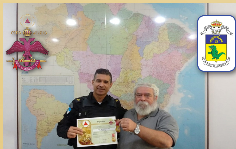
O SGC outorgando a Comenda de 194 anos de fundação do SC ao Cmte do 18º BPMRJ.