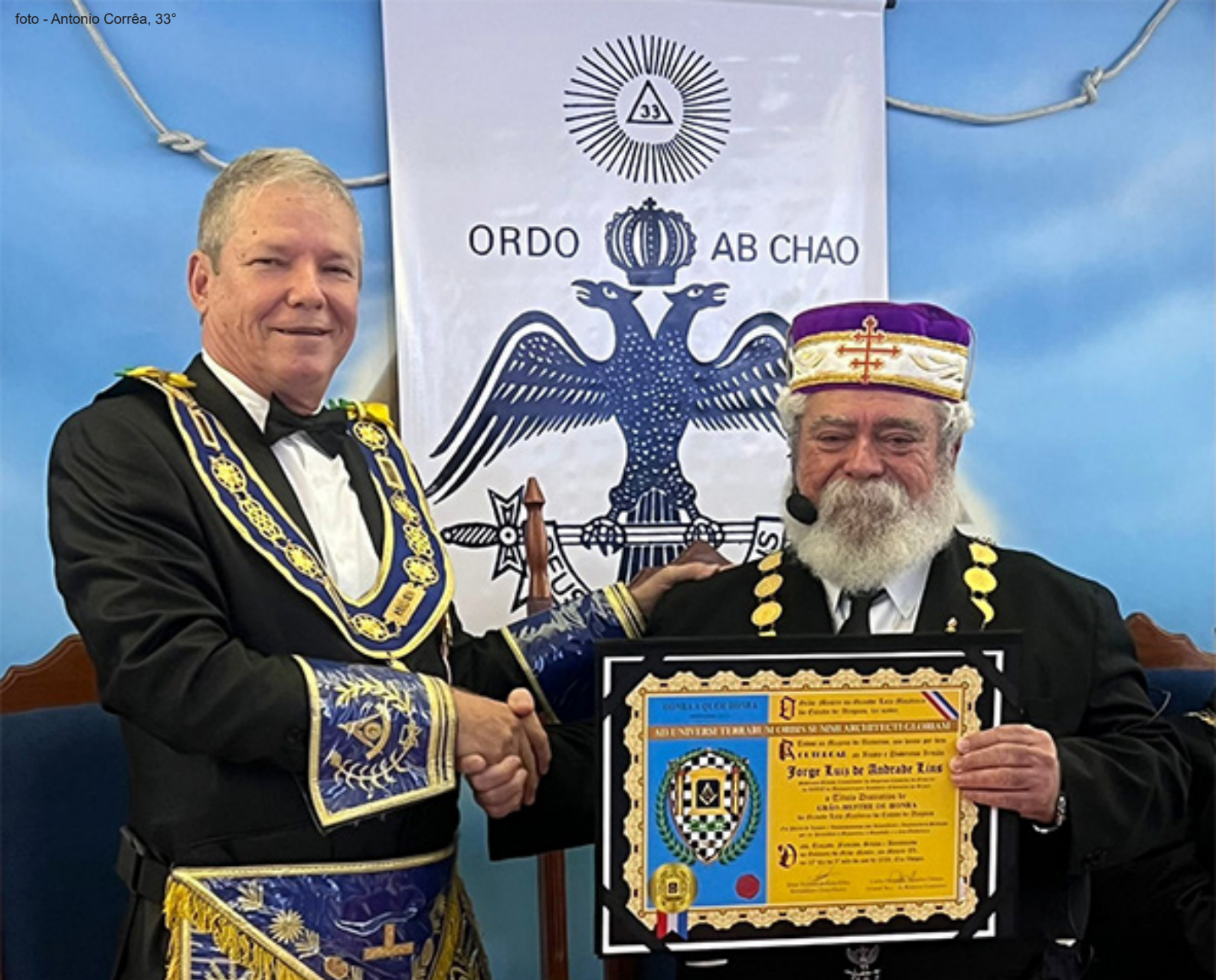
Cerimônia de Investidura, em Maceió: O SGC é agraciado com a outorga do título de Grão-Mestre de Honra da GLOMEAL, por seu Sereníssimo Grão-Mestre.

Litúrgica de Goiás, que ostenta uma das mais belas sedes, exclusiva para os Altos Graus. Na oportunidade, foram investidos novos 60 Grandes Inspectores Gerais.