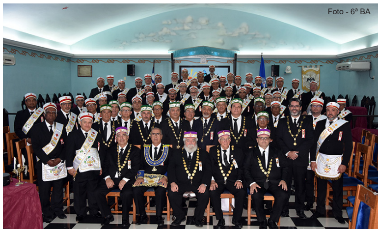
Cerimônia de Investidura em Vitória da Conquista - sede da 6ª GIL da Bahia.

Novamente, no mês de setembro, a Comitiva esteve na cidade de Vitória da Conquista, Sudoeste da Bahia, cerca de 1300 km da cidade do Rio de Janeiro,