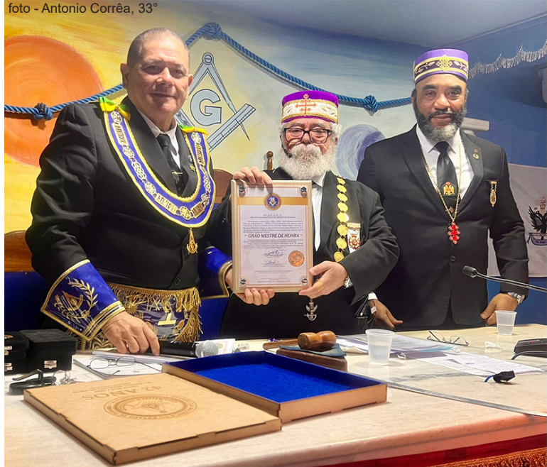
Em Boa Vista, o SGC foi agraciado com a outorga do título de GM de Honra da GLMERR.