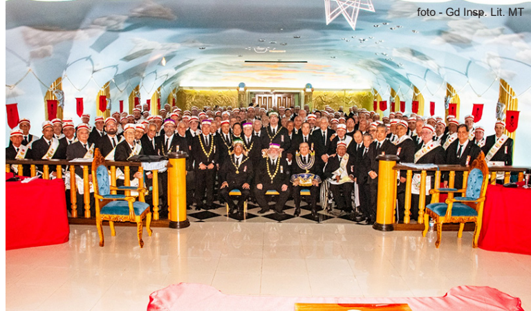
Cerimônia de Investidura em Cuiabá de 107 Irmãos - sede da GIL do Mato Grosso.

o Soberano Grande Comendador, aproveitando a oportunidade de estar na capital mineira, fez uma visita de cordialidade ao Grão-Mestre do GOMG – Grande Oriente de Minas Gerais (COMAB). Destacamos na cerimônia de investidura, a singular presença do Sereníssimo Grão-Mestre da GLMMG – Grande Loja Maçônica de Minas Gerais.