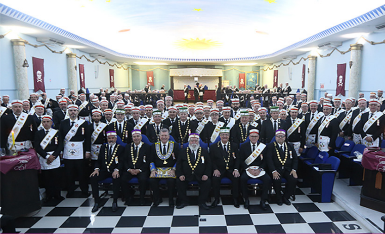
Cerimônia de Investidura em Florianópolis de 112 novos Grandes Inspetores Gerais.

sede da 6ª Grande Inspeção Litúrgica da Bahia. Foram investidos 48 Irmãos no Grau Maior do REAA. Destaque para a presença do Sereníssimo Grão-Mestre da GLEB – Grande Loja Maçônica do Estado da Bahia, e para a massiva presença dos Grandes Inspetores Litúrgicos do estado da Bahia - 13 dos 16 existentes.