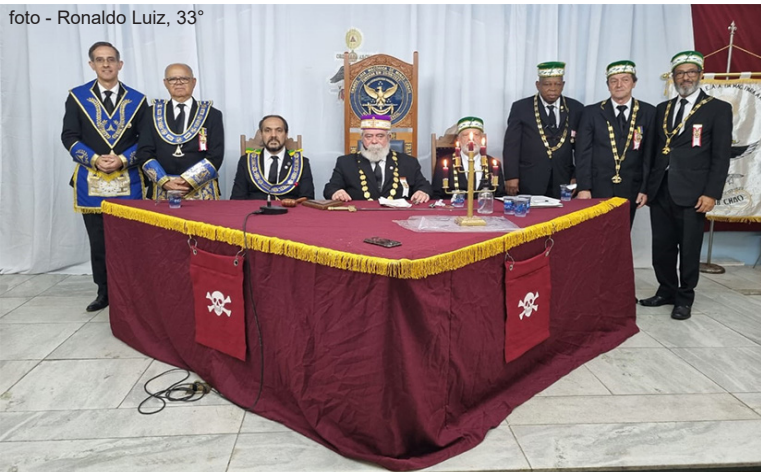
Cerimônia de Investidura em Belo Horizonte - sede da 1ª GIL de Minas Gerais.