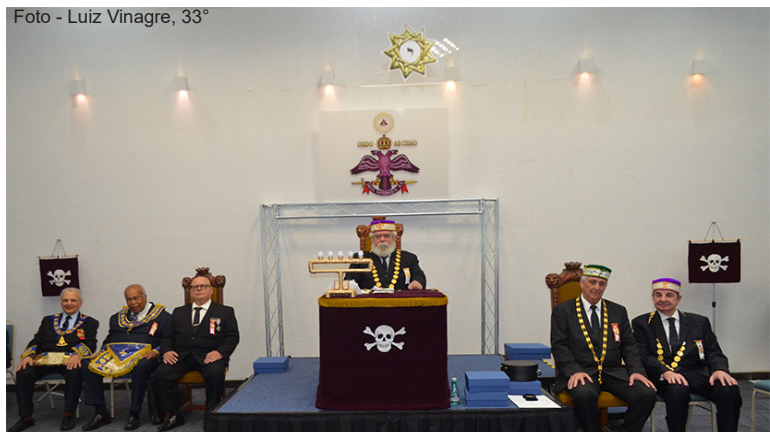
Cerimônia de Investidura de 143 Irmãos, em São Paulo - sede da 1ª GIL de SP.