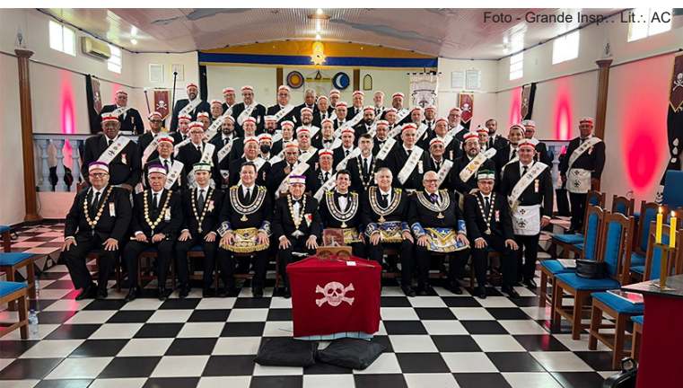
Cerimônia de Investidura de 14 Irmãos, em Rio Branco - sede da GIL do Acre.

Na sequência, a cidade que abrigou a Cerimônia de Investidura está a quase 3.000 km do Rio de Janeiro - a capital do Acre – Rio Branco. O evento foi realizado dentro da programação da comemoração do Jubileu de Ouro da GLEAC – Grande Loja Maçônica do Estado do Acre. Na ocasião, foram investidos 14 Irmãos. A Comitiva esteve sob o comando do Lugar Tenente Comendador, já que o Soberano Grande Comendador estava atendendo a compromissos internacionais nos Estados Unidos da América.