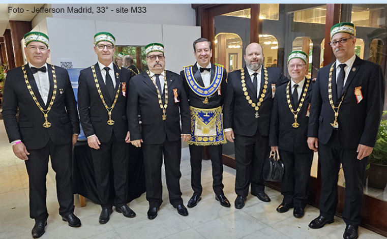
O GSG do SC, o Sereníssimo GM da GLOJARS e os GGILL da 2ª, 4ª, 5ª, 6ª e 7ª do RS.

Os Irmãos a serem investidos estavam distribuídos pelos seguintes Vales e Consistórios: CPPRS Sabedoria e Fraternidade – Vale de Pelotas – 2ª RS (20); CPPRS Terceiro Milênio – Vale de Ijuí – 3ª RS (27); CPPRS Amor e Liberdade – Vale de Bagé – 4ª RS (01); CPPRS Sepe Tiarajú – Vale de Santa Maria – 5ª RS (36); CPPRS Caxias do Sul – Vale de Caxias do Sul – 7ª RS (10), totalizando 94 Irmãos.