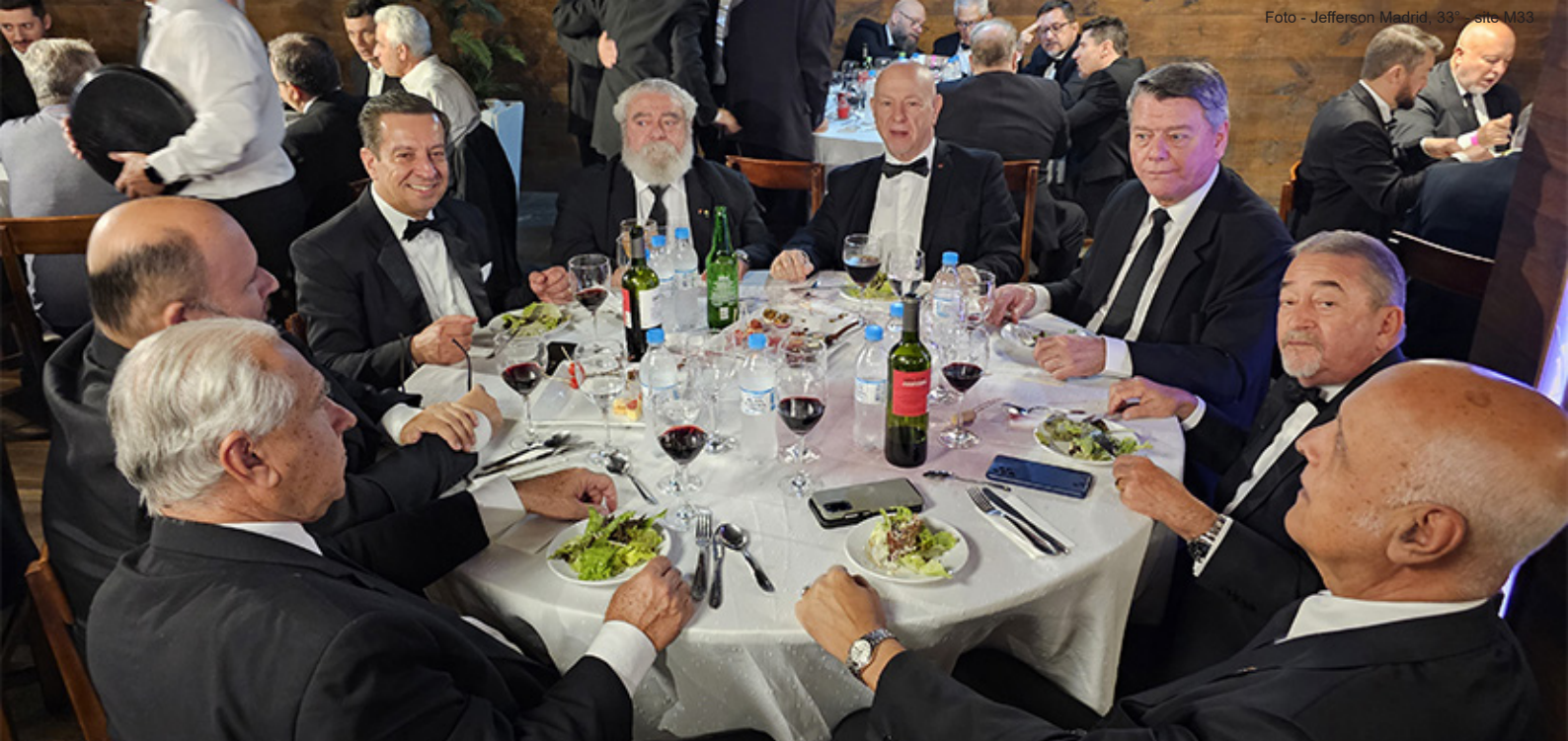
A Comitiva do Supremo Conselho, a Comitiva do SC para a República do Paraguai e o Sereníssimo Grão-Mestre da GLOJARS no Almoço de Confraternização.

palavra fazendo um breve relato sobre a GLOJARS, destacando que, naquela semana, registrou-se o expressivo número de 8888 Obreiros regulares.