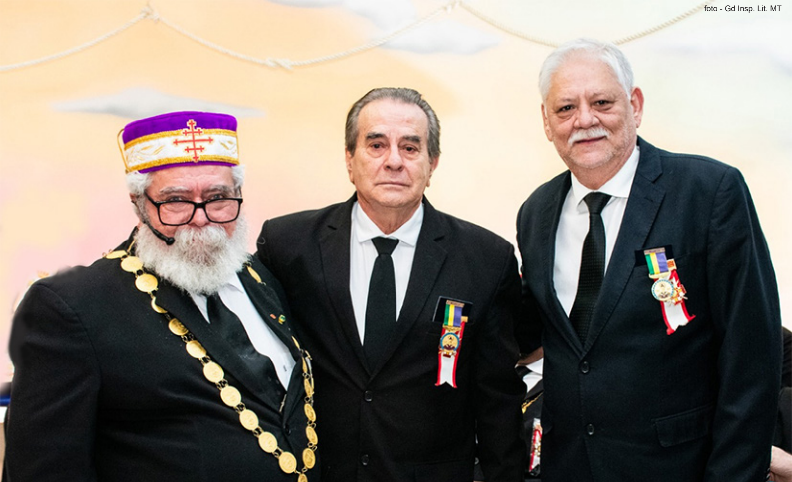
O Soberano Grande Comendador outorgou a Comenda e o Diploma dos 194 anos de fundação do Supremo Conselho aos Eminentes ex Grão-Mestres da GLEMT.