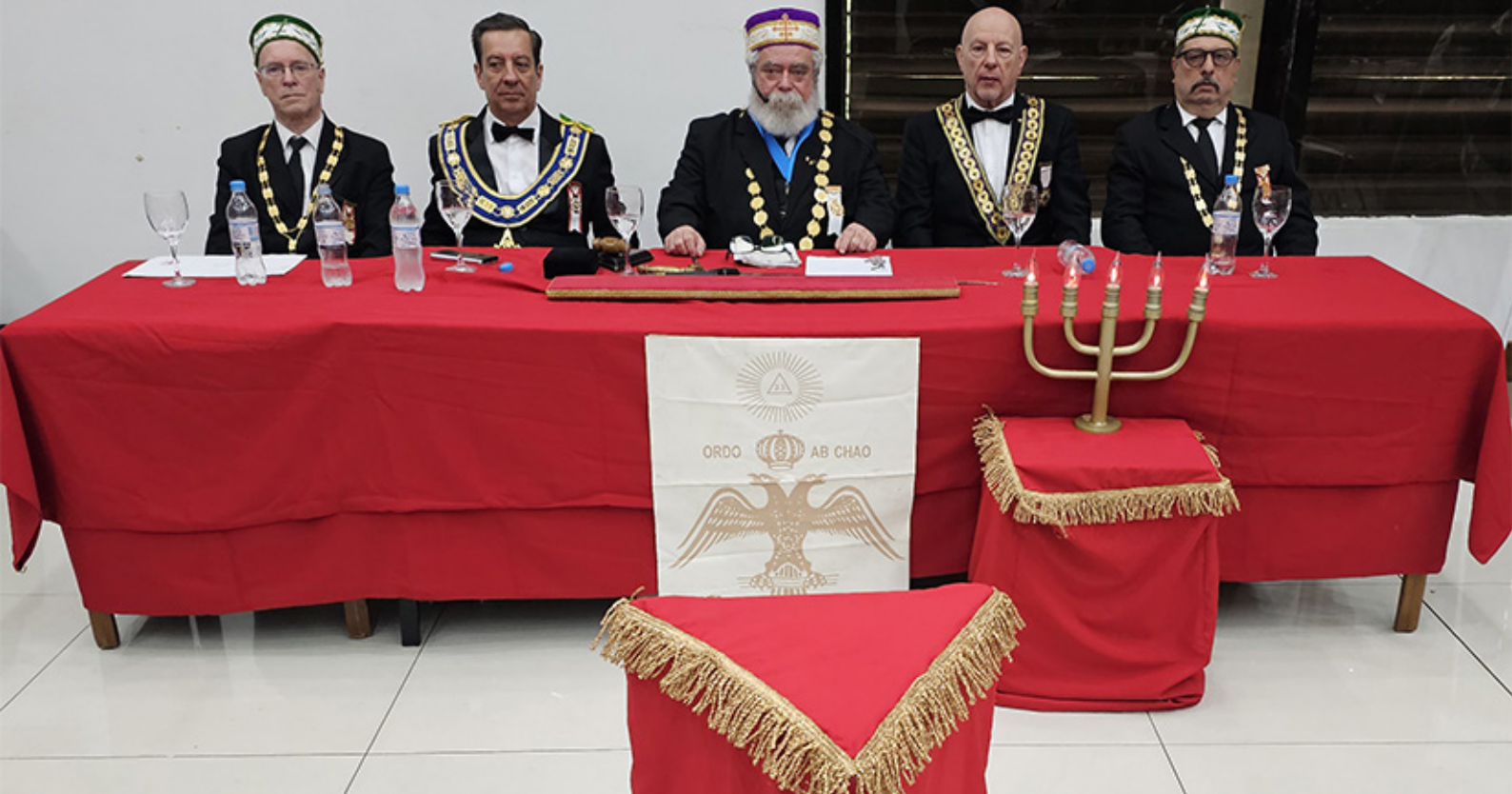
O SGC ao centro, ladeado à esquerda pelo Seren.: GM da GLOJARS e o GIL da 2ª RS, e, à direita, pelo SGC do Paraguai e pelo GIL 5ª RS (anfitrião).

foi reconhecida, recentemente, pela revista “ Guinness World Records ” como o local com os fósseis de dinossauros mais antigos do mundo. Eles viveram em 22 municípios da região central há 233 milhões de anos. O Museu Gama D’Eça foi inaugurado em 1968, e reúne, em seu acervo, materiais didáticos paleontológicos, arqueológicos e históricos, que contam um pouco da trajetória da Universidade Federal de Santa Maria. Em 1981, incorporou a seu acervo as peças do Museu Victor Bersani.