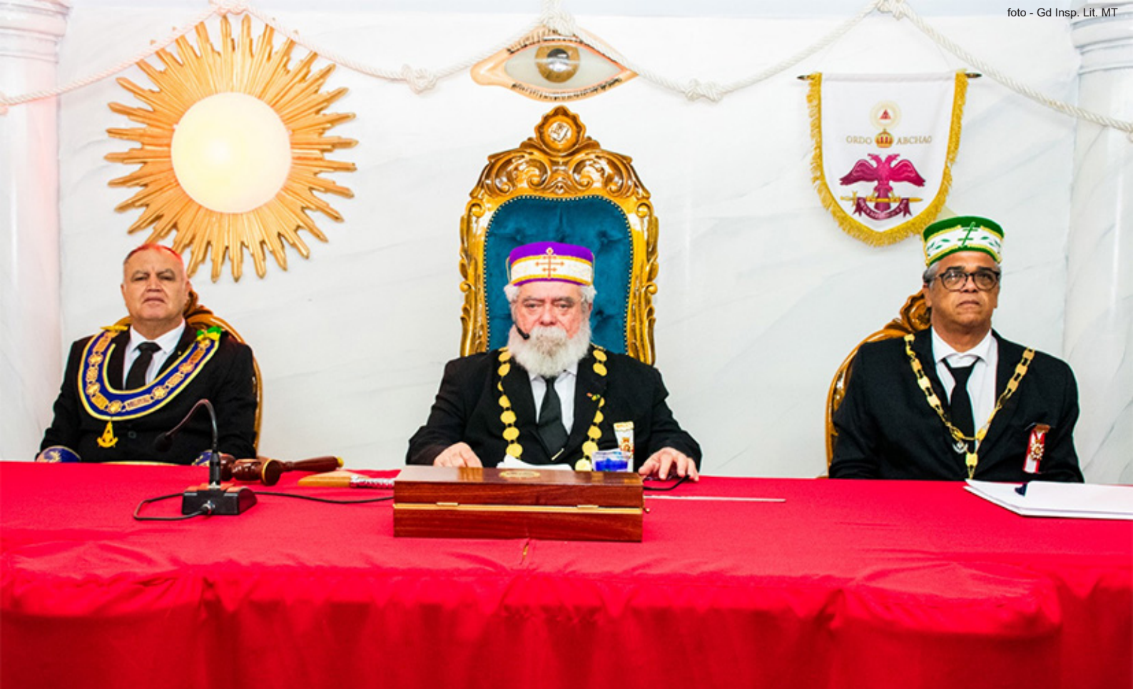
O Soberano Grande Comendador, ao centro, ladeado à esquerda, pelo Sereníssimo Grão-Mestre da GLOMARON e, à direita, pelo Grande Inspetor Litúrgico de MT.

registrou que Cuiabá foi considerada a cidade mais quente do mundo, recebendo essa classificação pela terceira vez, somente, nessa semana.