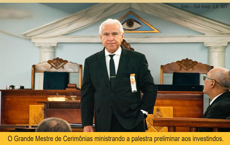
O Grande Mestre de Cerimônias ministrando a palestra preliminar aos investindos.