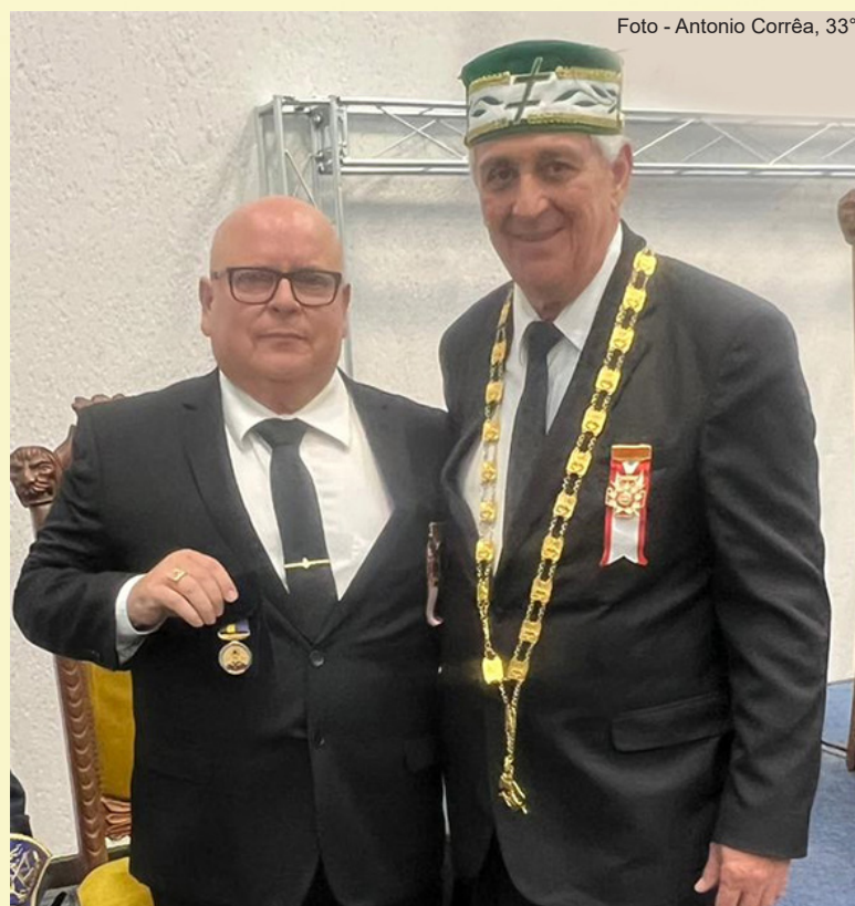
O Gd 1º.: Vig.: da GLESP recebendo a Comenda de 194 anos de fundação do SC.