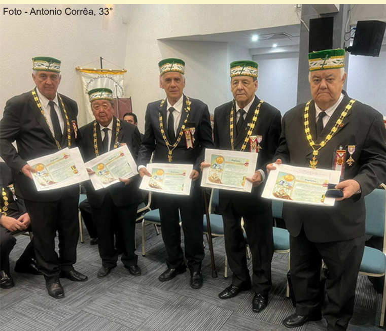
Os GGIILL recebendo a Comenda e Medalha de 194 anos de fundação do Supremo Conselho.

Com aquiescência do Soberano Grande Comendador, distribuiu alguns mimos – réplicas miniaturas dos aviões da Embraer KC-390 e C-190, sendo agraciados o Soberano Grande Comendador e os membros de sua Comitiva, além de o Presidente do CPPRS Saldanha Marinho (1ª SP) e um para ser entregue ao Grão-Mestre da GLESP.