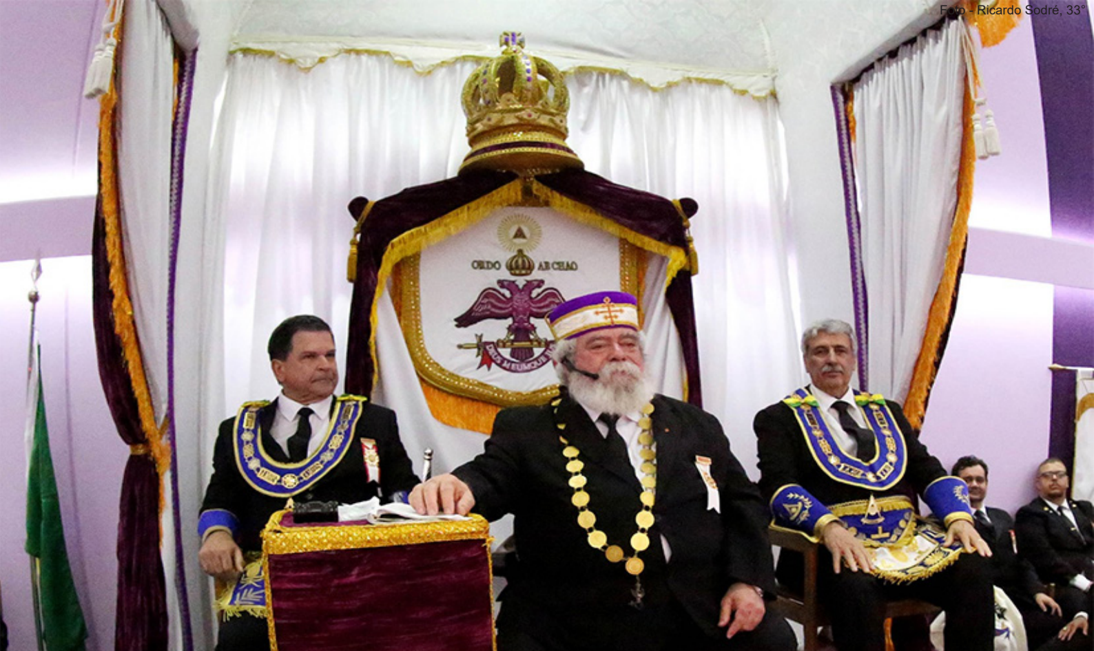
O Soberano Grande Comendador ao centro, tendo a sua direita, o Sereníssimo GM da GLMEES e, a sua direita, o Sereníssimo GM do GORJ.