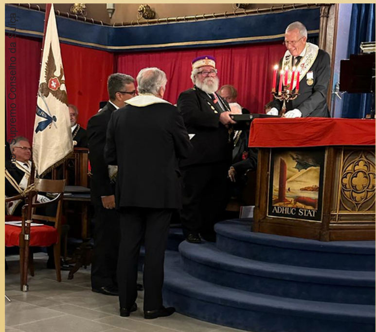
O SGC Jorge Lins, 33° faz a entrega de uma placa ao ex SGC do SC da Suíça.

A Comitativa deixou o país alpino na manhã do dia seguinte (25), às 07h45, fazendo conexão em Paris e desembarcando no Rio de Janeiro, às 19h35, consciente de ter cumprido, com excelência, mais um compromisso da vasta agenda internacional do Supremo Conselho.