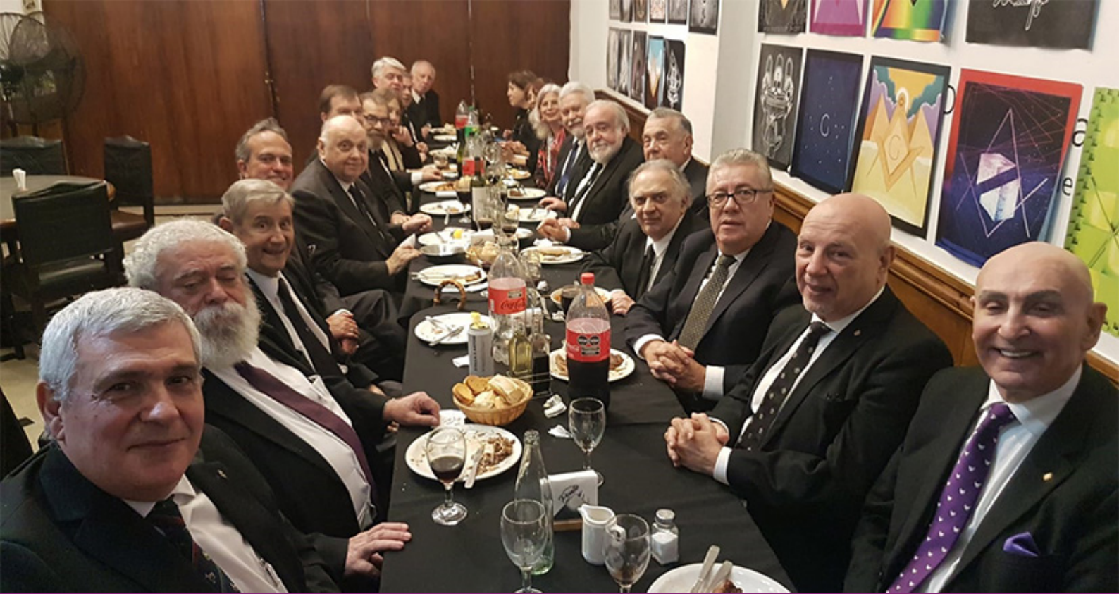
Jantar de confraternização no Restaurante do Palácio Cangallo, com a participação dos SGCs do Brasil, Uruguai, Argentina, Paraguai e Bolívia e demais participantes.

História, como ciência humanística que é, dá origem à interpretação ideológica dos acontecimentos que descreve (...) ”.