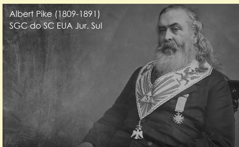
Albert Pike (1809-1891) SGC do SC EUA Jur. Sul