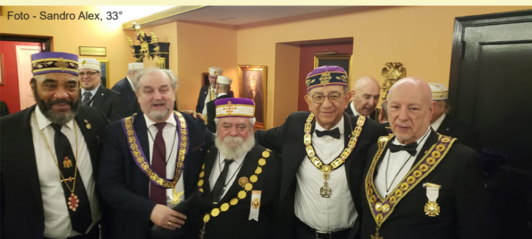
Os SGCs dos SCs do Haiti, da Romênia, do Brasil, do México e do Paraguai.

Como um dos maiores estudiosos do mundo sobre essa história, rituais e simbolismo da Maçonaria, em 2000, ele foi uma das três pessoas convidadas ao