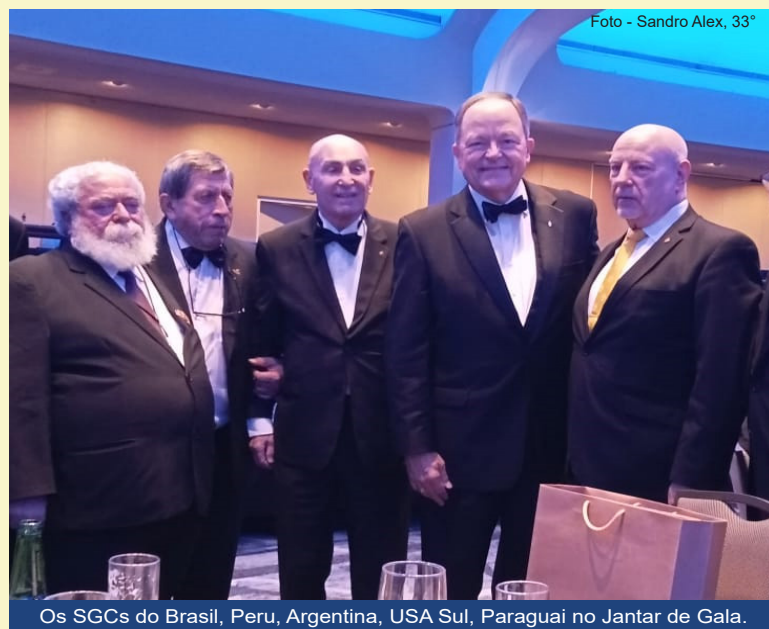
Os SGCs do Brasil, Peru, Argentina, USA Sul, Paraguai no Jantar de Gala.

A Comitativa deixou Washington DC na quarta-feira (23), com destino à cidade-condado de Louisville, no estado americano de Kentucky, a fim de participar da sessão Bienal do Supremo Conselho dos EUA, Jurisdição Norte. Matéria que registraremos a seguir. ✍