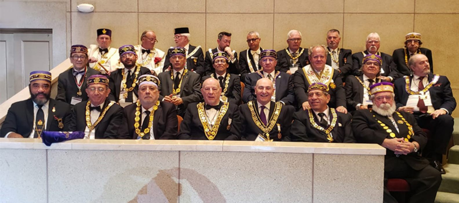
Os Soberanos Grandes Comendadores convidados participando da Sessão do Grau 33° realizada no Templo adaptado no Salão de Eventos do Hotel.

Vaticano pela Igreja Católica Romana para discutir a Maçonaria.