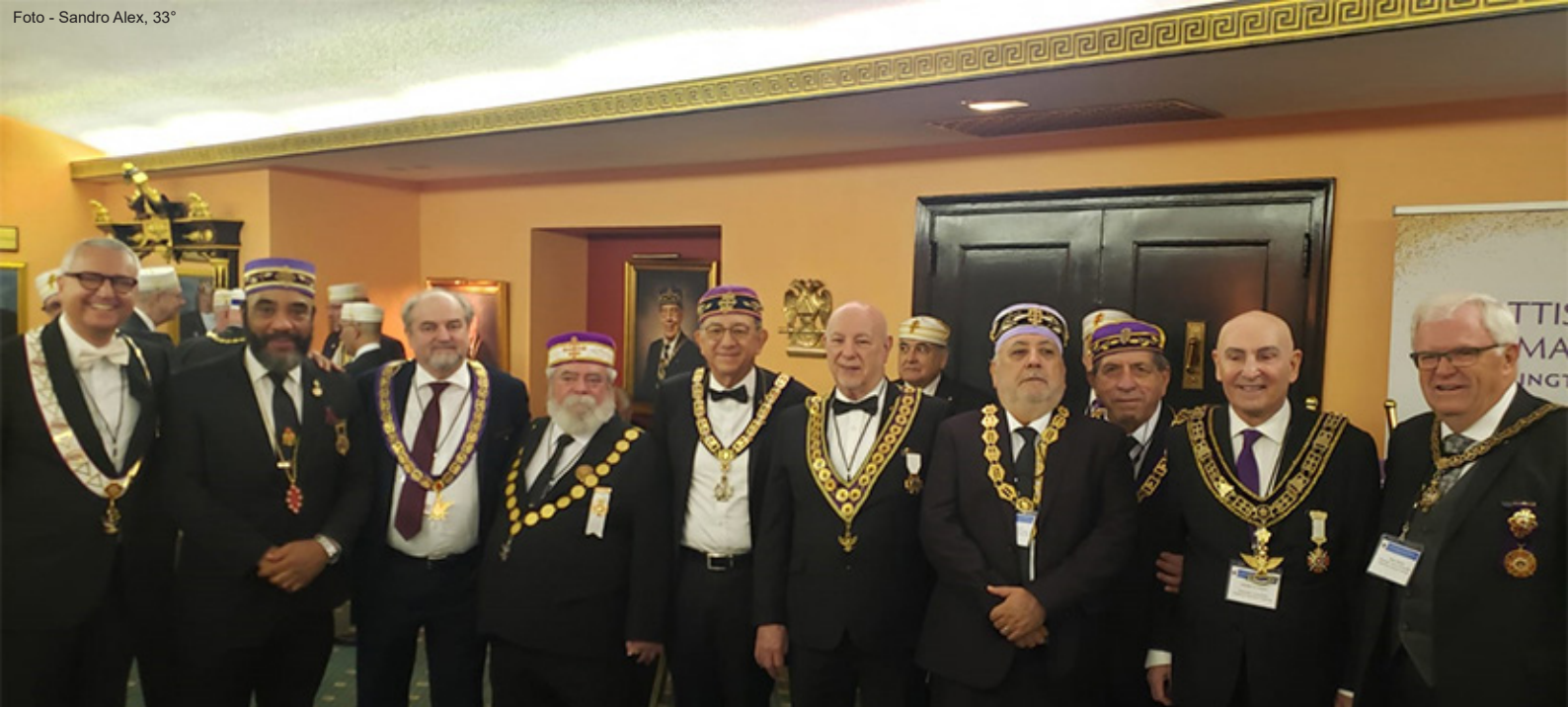
Da esquerda para direita: SGC Alemanha, SGC Haiti, SGC Romênia, SGC do Brasil, SGC México, SGC Paraguai, SGC Costa Rica, SGC Peru, SGC Argentina, SGC Canadá.

Pike ficou na História da Maçonaria como um dos mais importantes expoentes intelectuais, deixando cerca de 30 publicações sobre maçonaria, esoterismo, filosofia, assuntos militares e poesia.