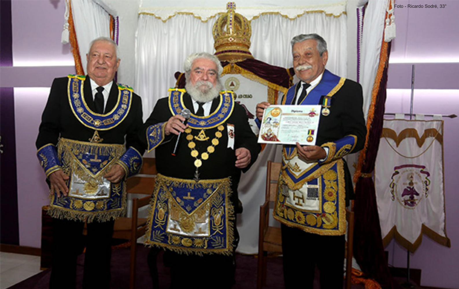
O Soberano Grande Comendador agradeceu o Eminentíssimo Grão-Mestre Adjunto da GLMERJ, com a Comenda e o Diploma dos 194 anos de fundação do SC.