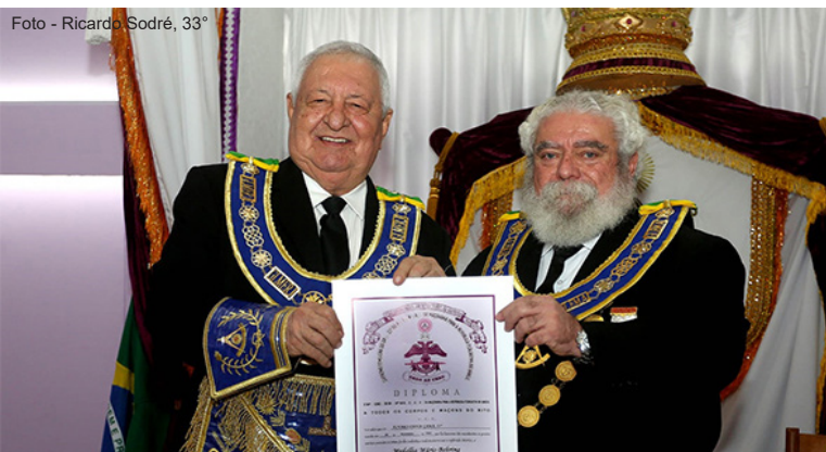
O SGC outorgou a Medalha e o Diploma Mario Behring ao Seren.: GM da GLMERJ.

Na oportunidade, o Sereníssimo Grão-Mestre da GLMERJ outorgou o título de Grão-Mestre de Honra ao Soberano Grande Comendador, em reconhecimento por seus relevantes serviços prestados à Maçonaria e