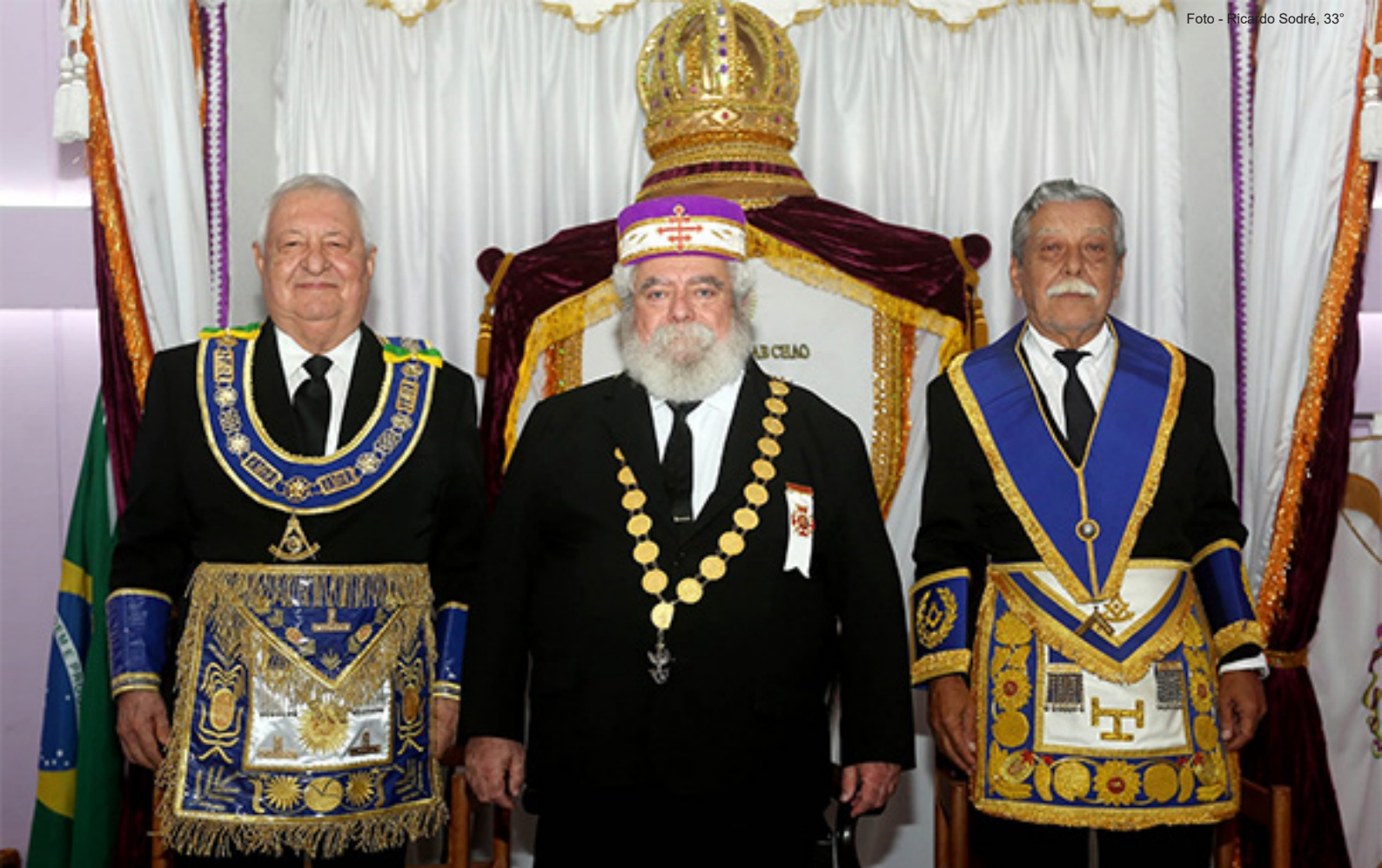
O Soberano Grande Comendador, ao centro, ladeado pelo Grão-Mestre e pelo Grão-Mestre Adjunto da Grande Loja Maçônica do Estado do Rio de Janeiro.

várias honrarias, a exemplo do título de Grão-Mestre de Honra.