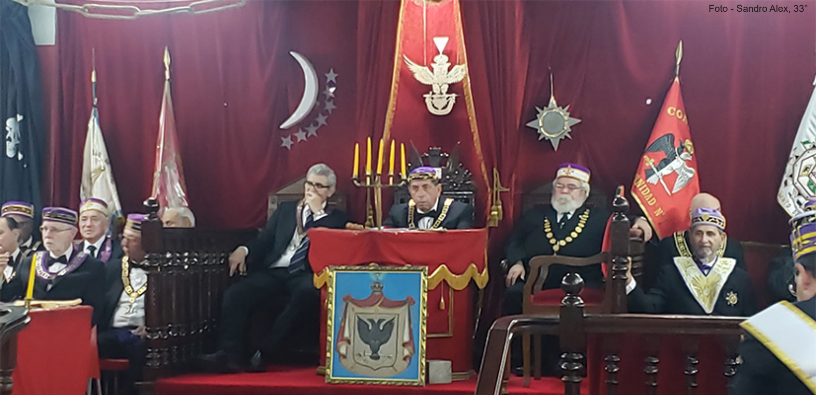
Cerimônia de Investidura no Grau 33° - Trono composto pelo SGC do SC do Peru, ao centro, ladeado pelos SGCs dos SCs mais antigos presentes, Espanha e Brasil.

Os Soberanos Grandes Comendadores/ Representantes receberam, previamente, os temas selecionados e fizeram a defesa de sua tese. Coube ao nosso Supremo Conselho o painel sobre “ Direitos Humanos ”, o qual mereceu um estudo cronológico, abordando conceitos antropológicos, desde a origem da espécie humana na face da Terra, até os dias atuais. Os aspectos filosóficos, sociológicos e jurídicos foram exaustivamente explorados, com citações de leis sumerianas, como o “ Código Estela dos Abutres ”, em Lagash, na Suméria, Sul da Babilônia, em 2.450 a.C., o mais antigo do mundo, descrevendo diversas Leis que foram utilizadas por diversas civilizações, fazendo, através desse passeio histórico, uma relação intrínseca com aspectos dos Altos Graus do REAA, culminando com a criação da ONU – Organização das Nações Unidas, e a promulgação da “ Declaração Universal dos Direitos Humanos ”, em 1948.