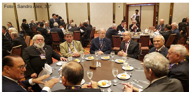
Jantar de Boas Vindas no Restaurante do Sheraton Lima Hotel & Convention Center.

A Maçonaria Simbólica, no Peru, teve sua chegada no início do século XIX, com o surgimento da “ Loja Paz y Perfecta Unión ”, fundada em 1817, e teria sido a primeira Loja Simbólica maçônica estabelecida no território do Peru, que era, na época, ainda, uma colônia espanhola. Foi em seus primórdios uma Loja