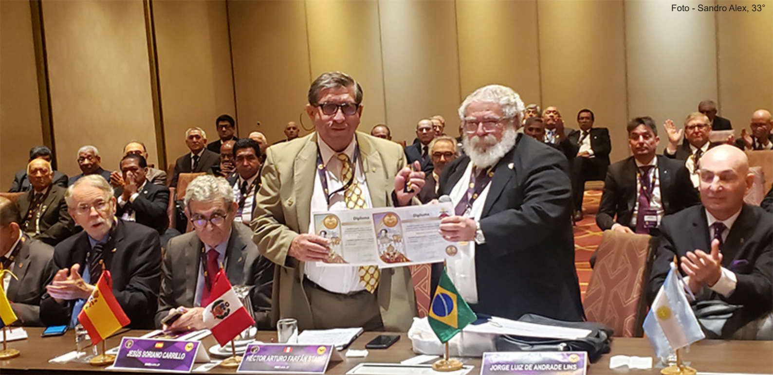
O SGC Jorge Lins, 33° condecora o SGC do Peru e o SC do Peru com a Comenda, a Medalha e os respectivos Diplomas dos 194 anos de fundação do nosso SC.

Após este breve preâmbulo, apresentando a cidade sede da XXI Reunião dos Soberanos Grandes Comendadores da América e uma breve abordagem sobre a origem da Maçonaria Peruana, daremos continuidade à cobertura da participação brasileira no evento.