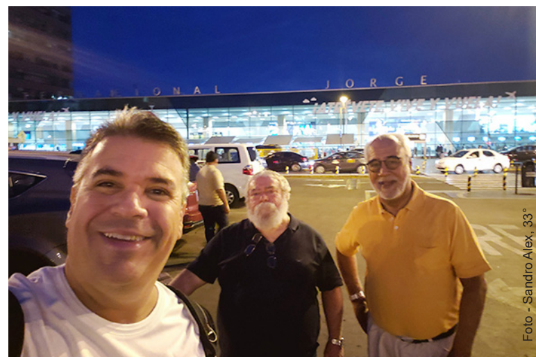
Chegada da Comitiva Brasileira, no Aeroporto Internacional de Lima - Peru.

Fundada há quase 500 anos, com o nome de "Ciudad de los Reyes", devido ao fato do território limenho ter sido invadido pelos espanhóis, em 06 de janeiro - Dia de Reis. A cidade é o lar de uma das mais antigas instituições de ensino superior no Novo Mundo. A Universidade Nacional de San Marcos, foi fundada em 12 de maio de 1551, durante o regime colonial espanhol. É a mais antiga universidade, em funcionamento contínuo, no continente americano. Cerca de um terço da população nacional vive na área metropolitana.