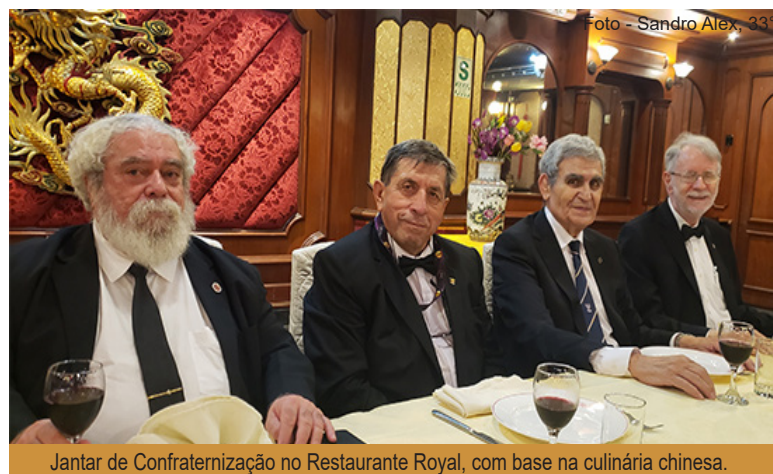
Jantar de Confraternização no Restaurante Royal, com base na culinária chinesa.

O sábado (18) foi reservado para um City Tour, pela cidade de Lima, onde os participantes puderam