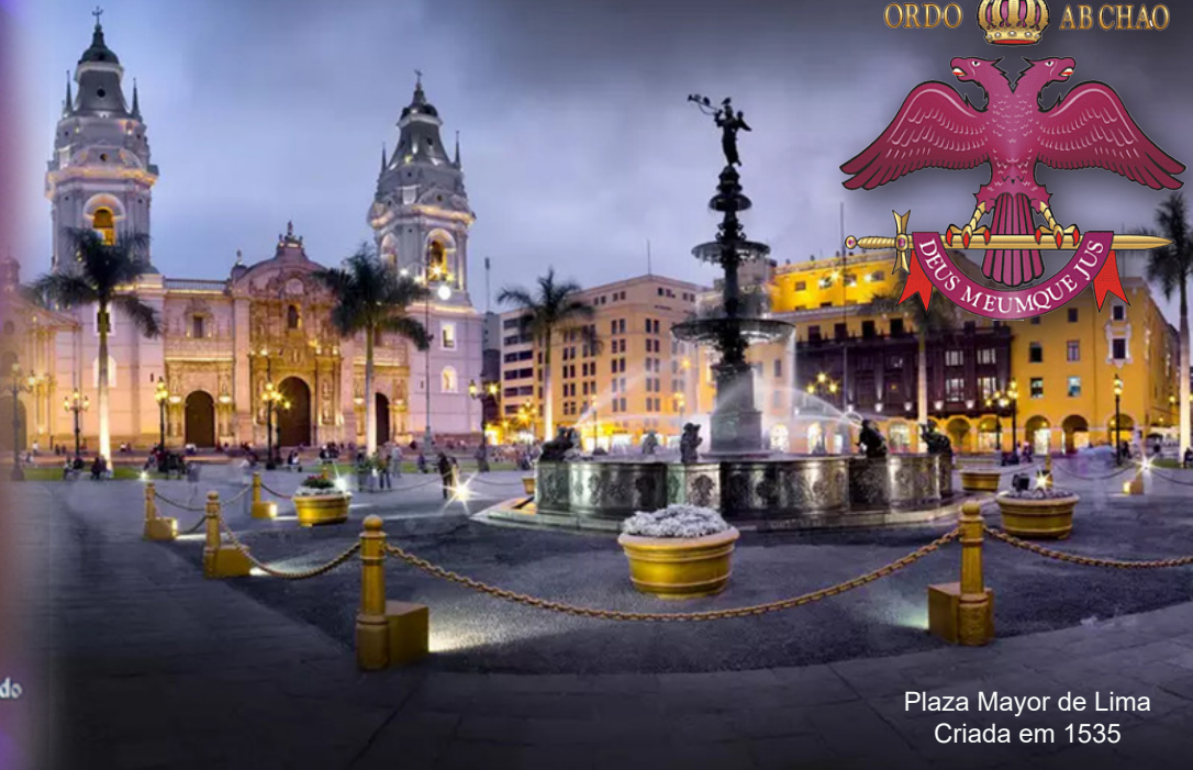
Plaza Mayor de Lima Criada em 1535

O Supremo Conselho segue em seu trabalho em prol do engrandecimento do Rito Escocês Antigo e Aceito, no que se refere a sua participação em eventos, tanto no âmbito nacional quanto internacional. O mês de março, em que se comemora mais aniversário de sua fundação, foi brindado com dois eventos internacionais.