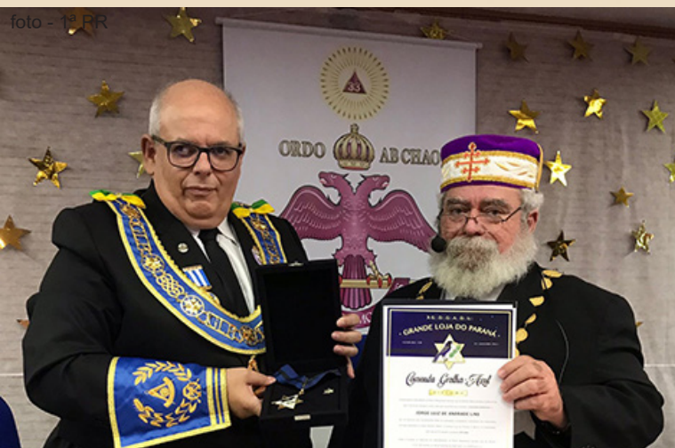
O SGC foi agraciado com a mais alta honraria da GLP - “Gralha Azul”, pelos relevantes serviços prestados à Ordem Maçônica, pelo Seren.: Grão-Mestre.