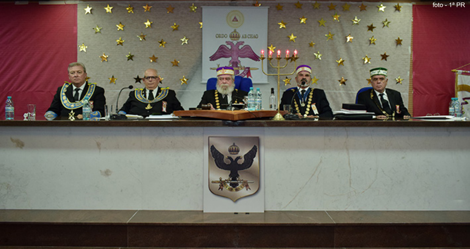
O Soberano Grande Comendador, ao centro, ladeado, à esquerda, pelo Sereníssimo Grão-Mestre da Grande Loja do Paraná e pelo Deputado do Grão-Mestre da Grande Loja Maçônica de Santa Catarina. À direita, pelo Membro Efetivo e SGIL da 1ª PR e pelo GIL da 3ª PR.