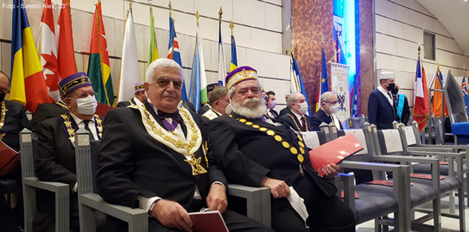
O SGC na Sessão de Encerramento das Atividades Solsticiais, no Templo Nobre "Maison des Maçons", na sede da Grande Loja Nacional da França.

Às 20h, foi oferecido um Jantar no "Le Precope Café e Restaurant", considerado o mais antigo de Paris, em operação, sendo inaugurado em 1686, pelo Chefe siciliano Francesco Procopio dei Coitelli.