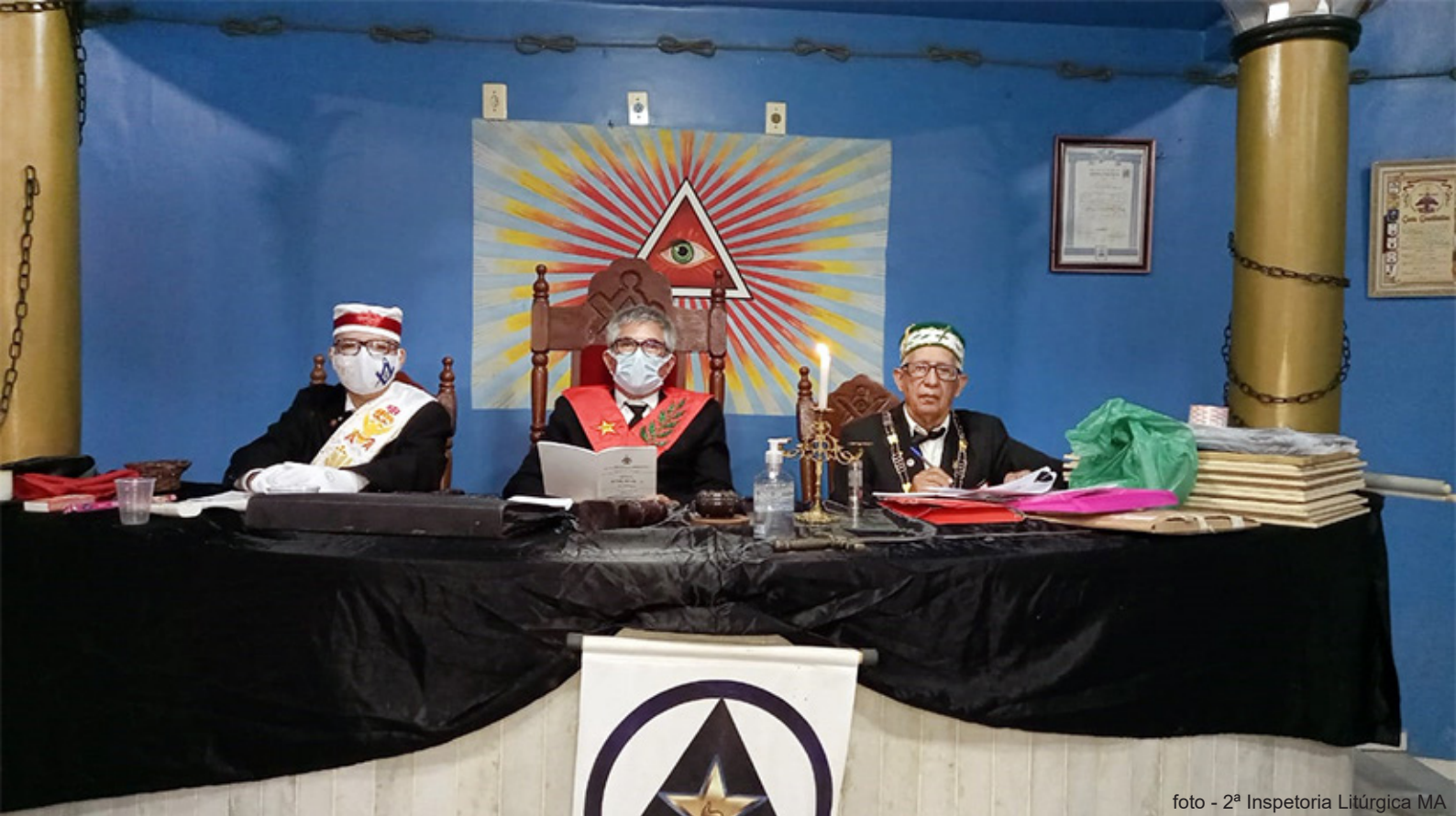
foto - 2ª Inspeção Litúrgica MA

46, jurisdicionada à GLEMA – Grande Loja Maçônica do Estado do Maranhão. Devido à limitação do tamanho do Templo e às determinações de espaçamento entre os Irmãos, de parte das autoridades sanitárias local, foram necessárias certas adaptações, tendo que a iniciação, daquele grupo de sessenta e dois Irmãos, tivesse que ser realizada em quatro turmas, em momentos distintos.