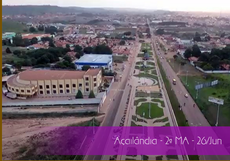
Açailândia - 2ª MA - 26/Jun