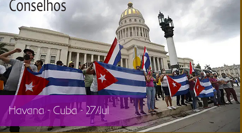
Havana - Cuba - 27/Jul