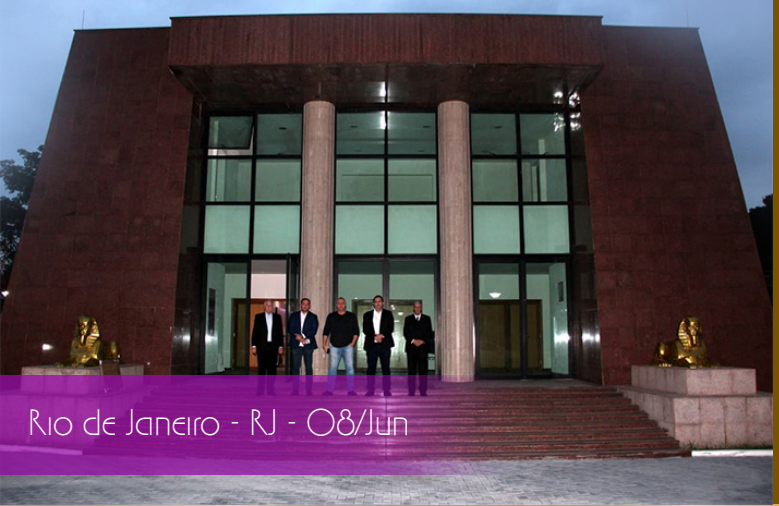
Rio de Janeiro - RJ - 08/Jun

Excelsa Loja de Perfeição Monte Moriah Instalação e Posse