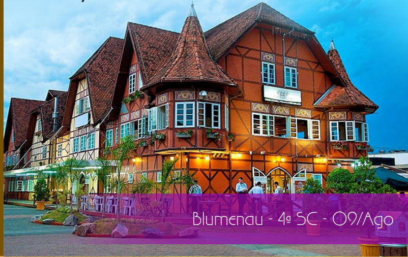
Blumenau - 4ª SC - 09/Ago

Excelsa Loja de Perfeição Monte Moriah Instalação e Posse