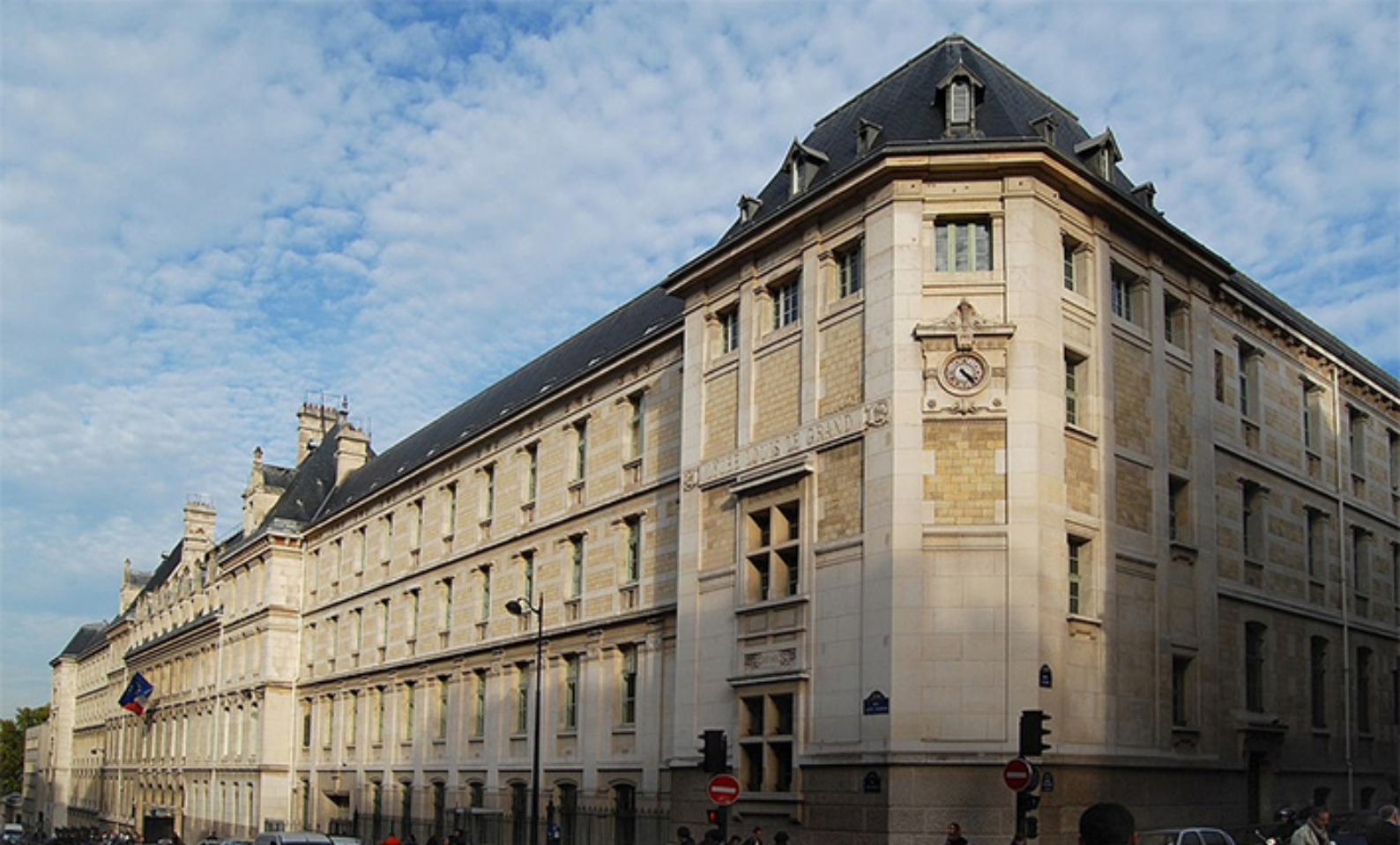
Colégio Louis-le-Grand, em Paris, na França. Sua origem remonta ao século XVI, quando foi criado por jesuítas, em 1º de julho de 1563, sob o nome de Collège de Clermont. Em sua sede, em 1754, foi criado o Capítulo Clermont, pelo Cavaleiro de Bonneville, em honra ao Conde de Clermont.

universais; 2ª) Graus de desenvolvimento dos Graus Simbólicos e universais; 3ª) Graus baseados no Iluminismo do Tribunal da Santa Vingança ou Santa Vehme; 4ª) Graus judaicos e bíblicos; 5ª) Graus Templários; 6ª) Graus Alquímicos e Rosacruçianos; 7ª) Graus Administrativos e Superiores”.