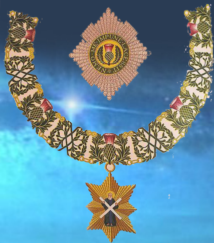
Comenda da Ordem do Cardo

Na Maçonaria, ao longo de sua história, foram criados e praticados diversos Ritos. Há quem afirme se chegar a mais de 200 Ritos, cada qual com características e aspectos distintos, elaborados sob a influência de uma determinada época, exaltando determinados valores, através de lendas, conceitos e preceitos, tendo todos como principal objetivo, o aprimoramento e a evolução do maçom.