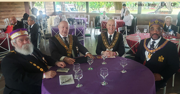
Da esquerda para a direita, os Soberanos Grandes Comendadores dos Supremos Conselhos do Brasil, do Paraguai, da Argentina e do Haiti