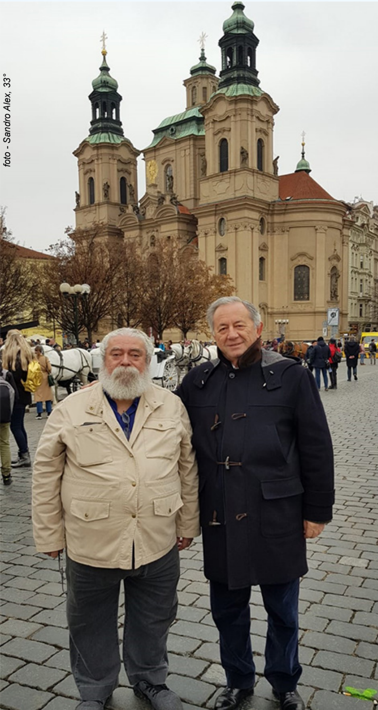
Os SGC's do Brasil e da Itália na Praça da Cidade Velha, em Praga, tendo ao fundo, o prédio de arquitetura barroca, a Igreja de São Nicolau, construída em 1732.

O início da Maçonaria Tcheca regular está ligado à Associação Charitas de Praga, com a criação da “Loja Maçônica Hiram das Três Estrelas”. Foi nessa loja que, em 1909, os fios dos anéis maçônicos de Praga ou das grinaldas fraternas se juntaram, e essa loja se tornou o berço da Maçonaria Tcheca e Alemã, em Praga. Existem diversas lendas sobre os primórdios da Maçonaria Tcheca, dando uma origem distante, porém nada foi possível ser documentado e nem teve apoio em fatos.