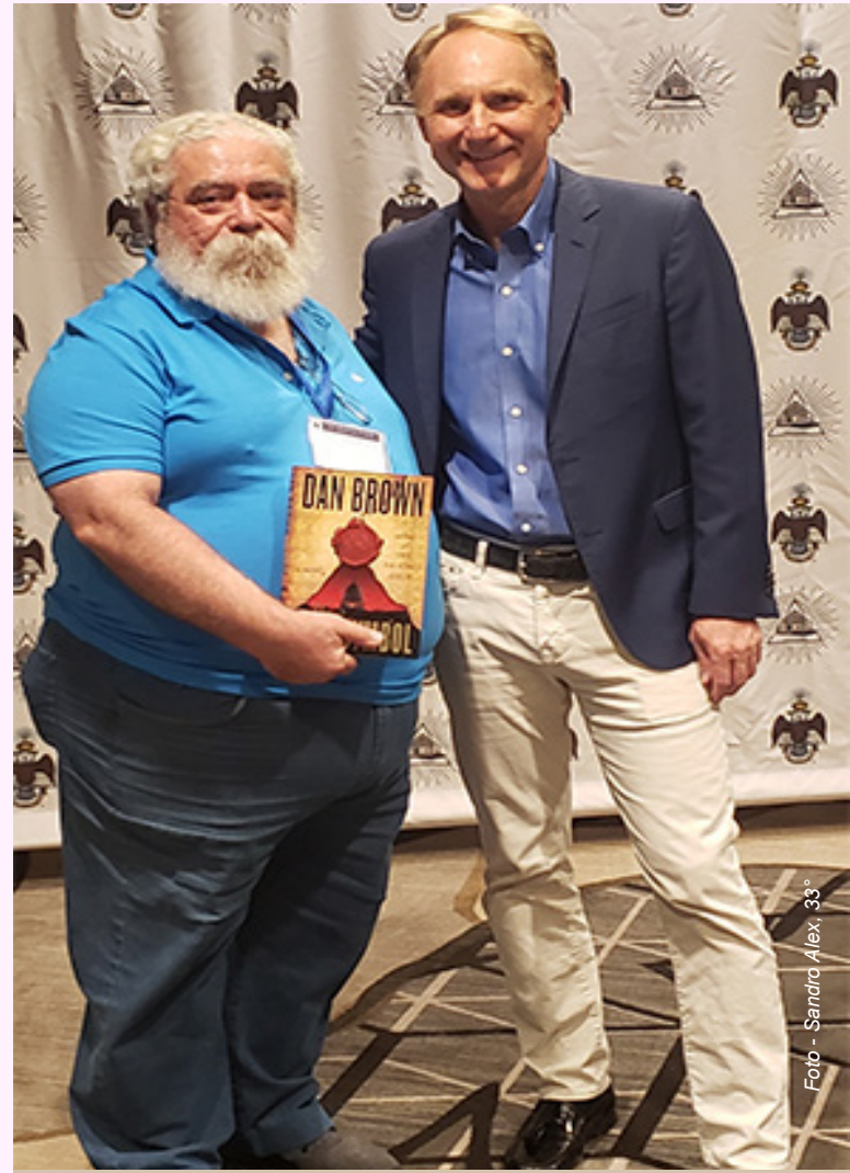
O SGC recebe um exemplar do livro autografado pelo autor Dan Brown

O Soberano Grande Comendador, também, recebeu um exemplar autografado do livro “ The Lost Symbol ” – O Símbolo Perdido, pelo seu ilustre autor, o famoso escritor Dan Brown.