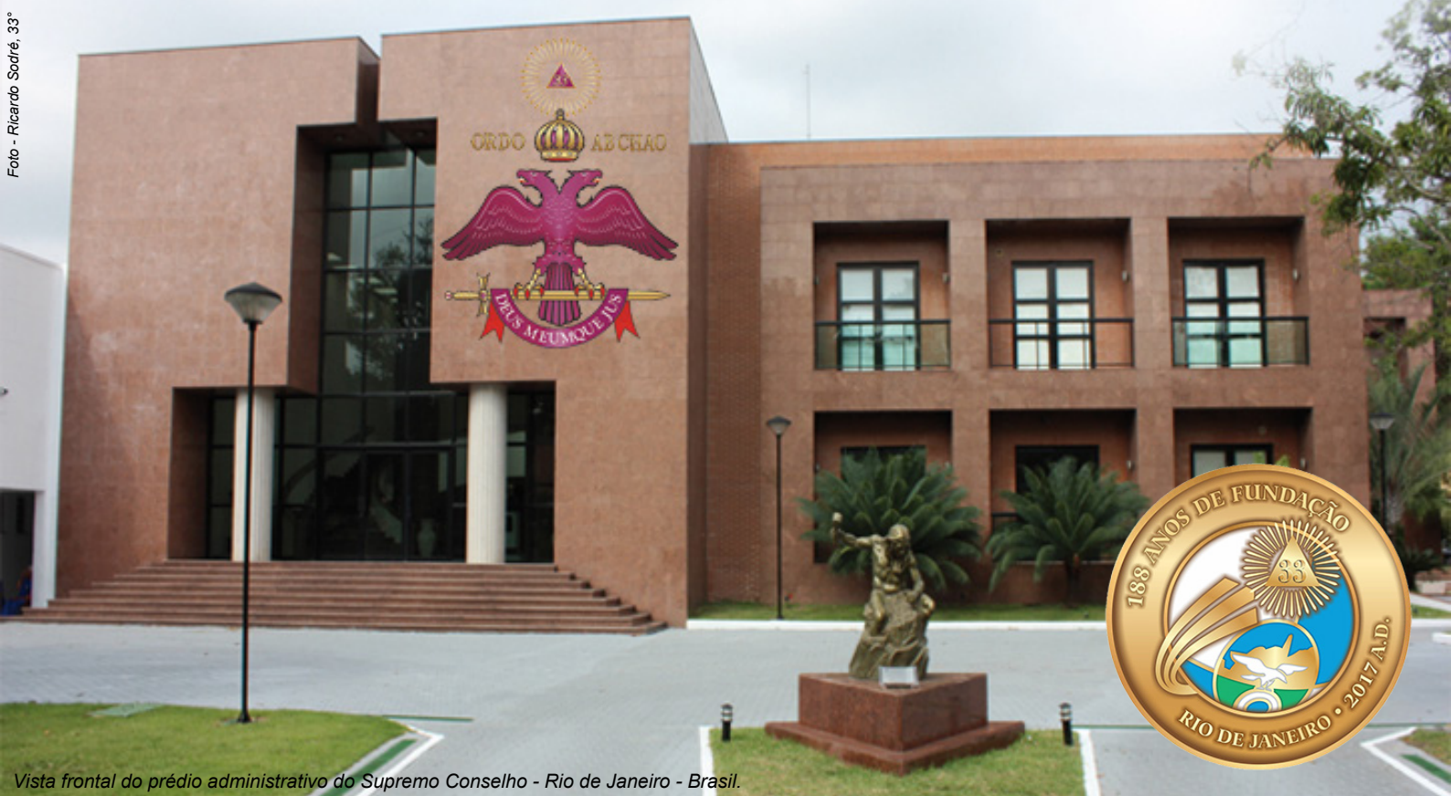
Vista frontal do prédio administrativo do Supremo Conselho - Rio de Janeiro - Brasil.

E sta edição traz a participação do Supremo Conselho no X Encontro de Soberanos Grandes Comendadores da América do Sul, realizado em Lima, no Peru, sob a coordenação do Supremo Consejo do Grado 33° del Rito Escocés Antigo Y Aceptado para la República del Perú. Os temas do evento foram “O Papel dos Supremos Conselhos do Grau 33° no Século XXI” e “Os Desafios da Ecologia e os Cuidados Ambientais”.