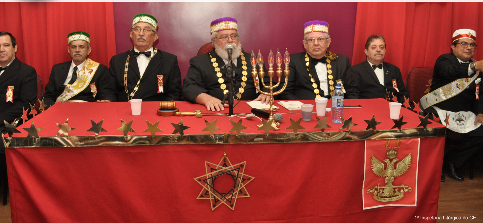
1ª Inspeção Litúrgica do CE

Chegamos a “Terra da Luz”, embora há quem a chame de “A Loira Desposada do Sol”, a aconchegante capital cearense, a bela Fortaleza, que muito se orgulha de ter sido o berço de ilustres brasileiros como o ex-presidente Castelo Branco, Dom Helder Câmara, Raquel de Queiroz, e por que não citar o ilustre José de Alencar, através do qual, também, recebeu o título de “Capital Alencariana”.