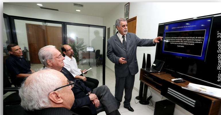
Presidente da AMEM-Brasil apresentando a história e os propósitos da Associação dos Médicos Maçons ao Soberano Grande Comendador

Hoje, a AMEM-Brasil conta com diversos médicos maçons associados, em 13 estados da