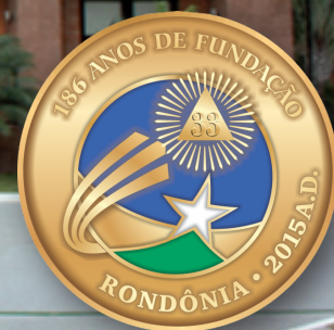
Complexo Administrativo do Supremo Conselho - Rio de Janeiro - Brasil.

N esta edição, mais uma vez, registramos o incansável trabalho itinerante da Comitiva do Supremo Conselho, deslocando-se por todo o território nacional, a fim de proporcionar aos irmãos postulantes do Rito mais praticado no Brasil, ascender a seu patamar maior. Nesta oportunidade, a Comitiva realizou com sucesso, em 29 de agosto, na “Capital Pantaneira”, a acolhedora cidade de Cuiabá, em Mato Grosso, e, em 19 de setembro, na maior cidade da América do Sul, a “Terra da Garoa”, cidade de São Paulo, duas marcantes investidas ao Grau de Grande Inspetor Geral da Ordem.